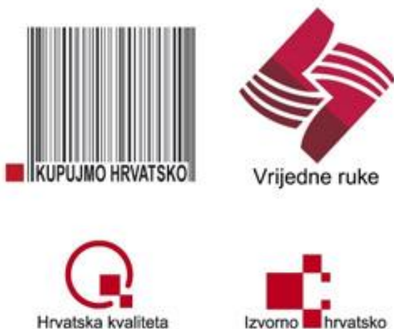
Slika 4: Znakovi „Kupujmo hrvatsko“ i „Izvorno hrvatsko“ 30