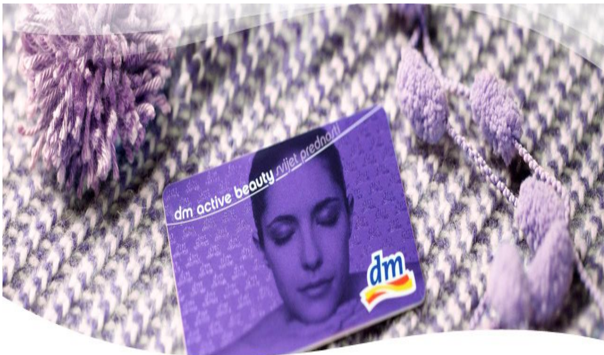
Slika 5: Prikaz dm active beauty kartice