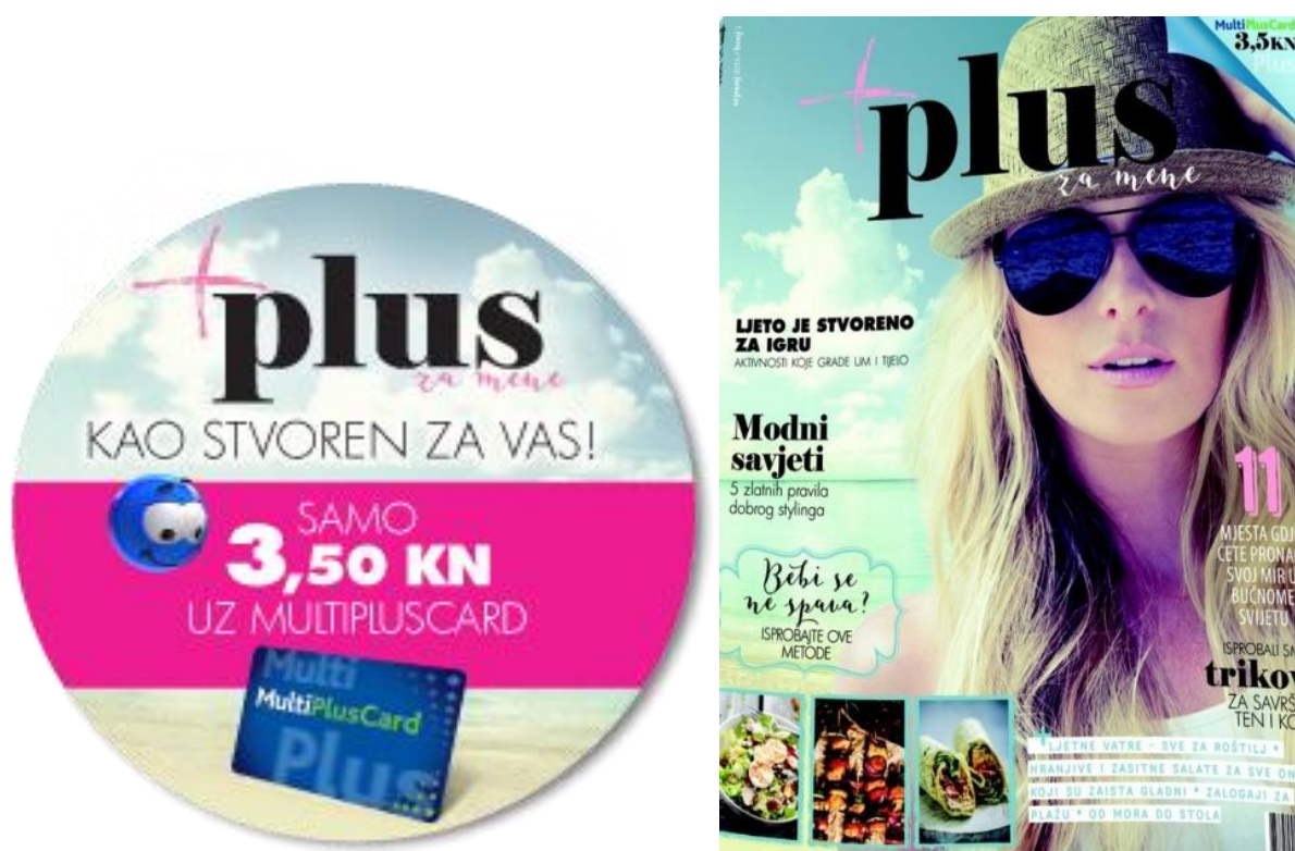
Slika 3: Prikaz magazina „Plus za mene“