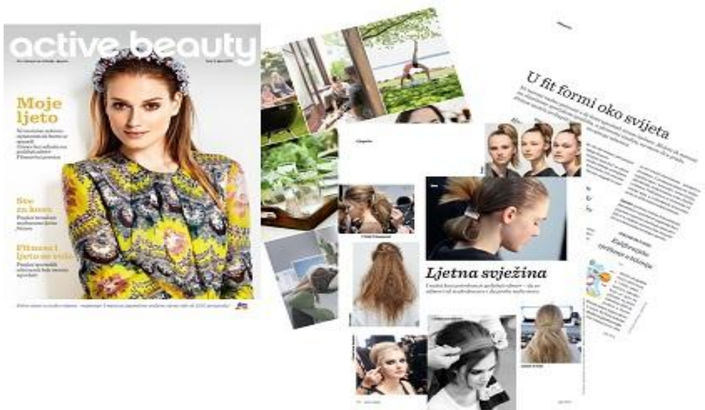
Slika 4: Primjer dm active beauty časopisa

Čitanje časopisa dostupno je i u online izdanju te se tako može čitati i putem interneta preko računala ili pametnih telefona.