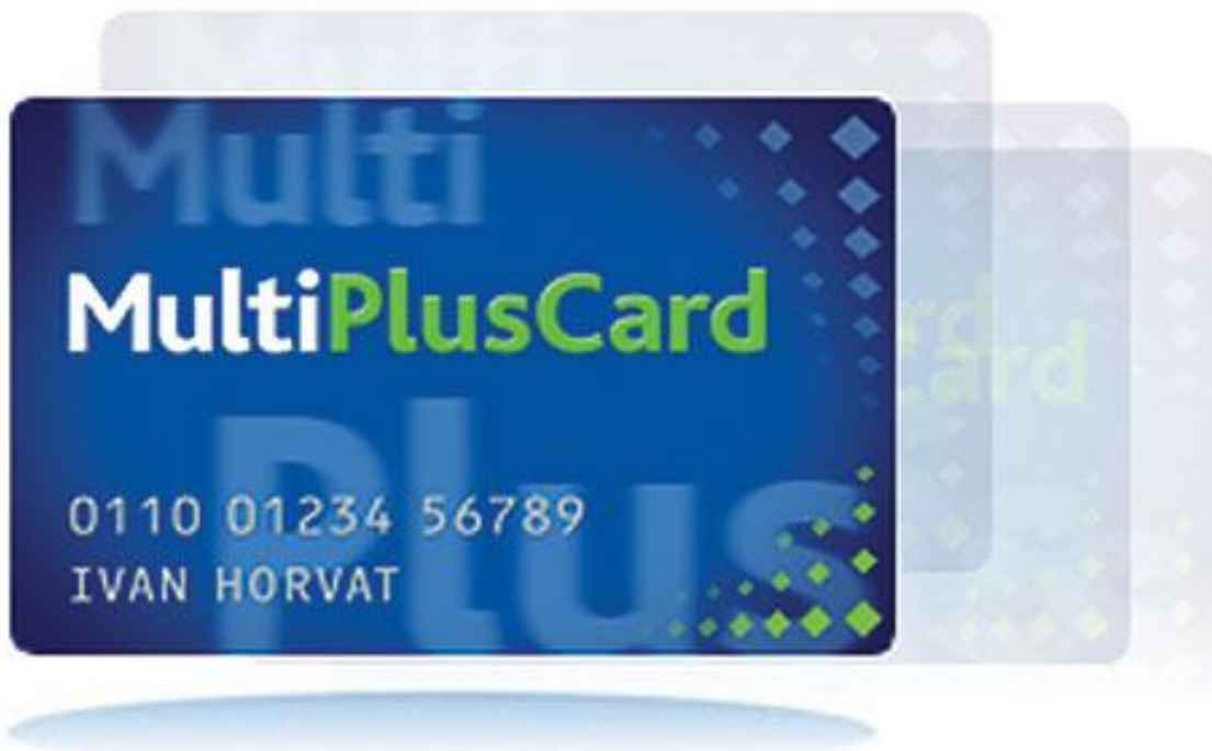
Slika 2: Prikaz MultiPlusCard kartice