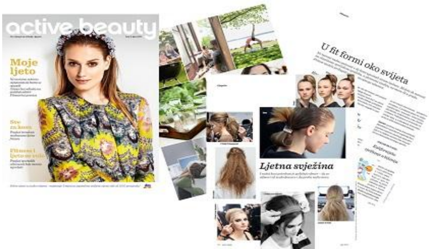
Slika 4: Primjer dm active beauty časopisa

Čitanje časopisa dostupno je i u online izdanju te se tako može čitati i putem interneta preko računala ili pametnih telefona.