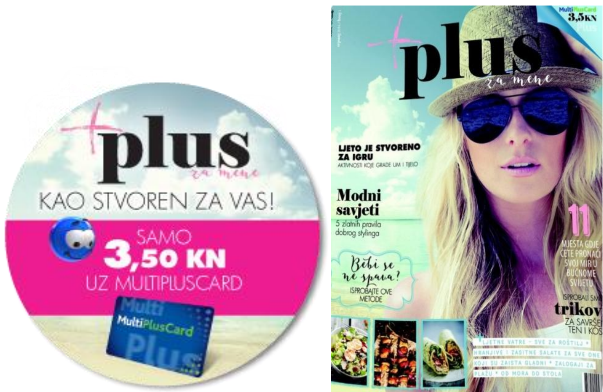
Slika 3: Prikaz magazina „Plus za mene“