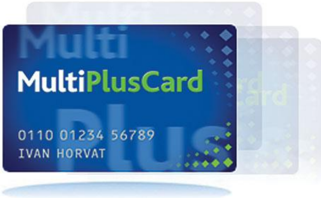
Slika 2: Prikaz MultiPlusCard kartice