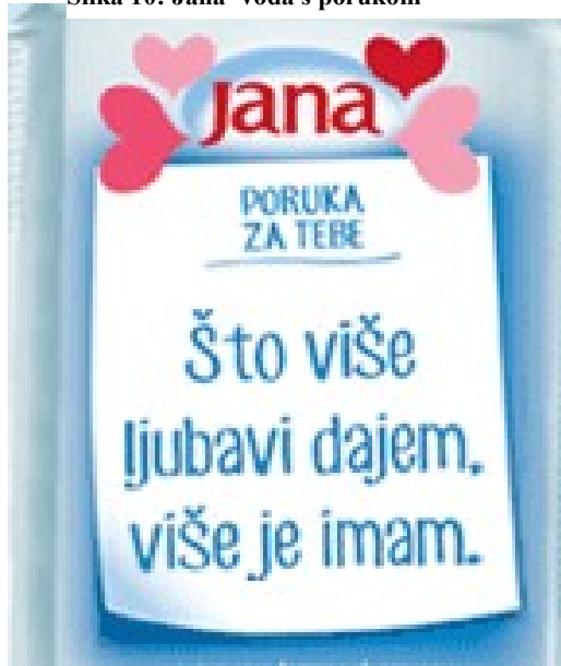
Slika 10: Jana- voda s porukom