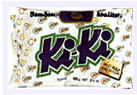
Slika 2: Pakiranje Ki-Ki bombona sa sloganom

Apel na zabavu i humor je ono što privlači najmlađi segment na tržištu jer takvi proizvodi garantiraju odlične okuse i puno zabave. Lako pamtljivi i jednostavni stihovi u promotivnim aktivnostima Ki-Ki bombona također su plus, a „Bilo kuda, Ki-Ki svuda“ je slogan koji pamti mnogo generacija ljudi i neće se zaboraviti.