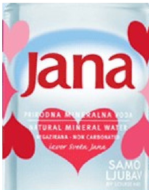
Slika 9: Janina etiketa s prednje strane