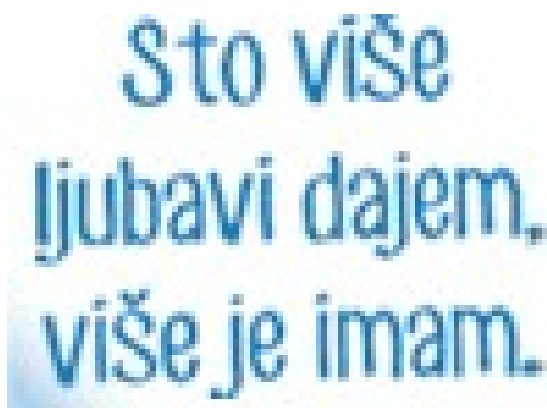
Slika 17: Poruka ljubavi