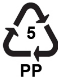
Slika 12: Ambalažna oznaka 2

Ovaj simbol koji se nalazi na ambalaži označava da je ambalaža namijenjena za jednokratnu upotrebu te da je u direktnom dodiru s prehrambenim namirnicama i pićima, svojim sastavom ne šteti ljudima koji konzumiraju njen sadržaj.