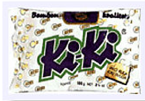
Slika 2: Pakiranje Ki-Ki bombona sa sloganom

Apel na zabavu i humor je ono što privlači najmlađi segment na tržištu jer takvi proizvodi garantiraju odlične okuse i puno zabave. Lako pamtljivi i jednostavni stihovi u promotivnim aktivnostima Ki-Ki bombona također su plus, a „Bilo kuda, Ki-Ki svuda“ je slogan koji pamti mnogo generacija ljudi i neće se zaboraviti.