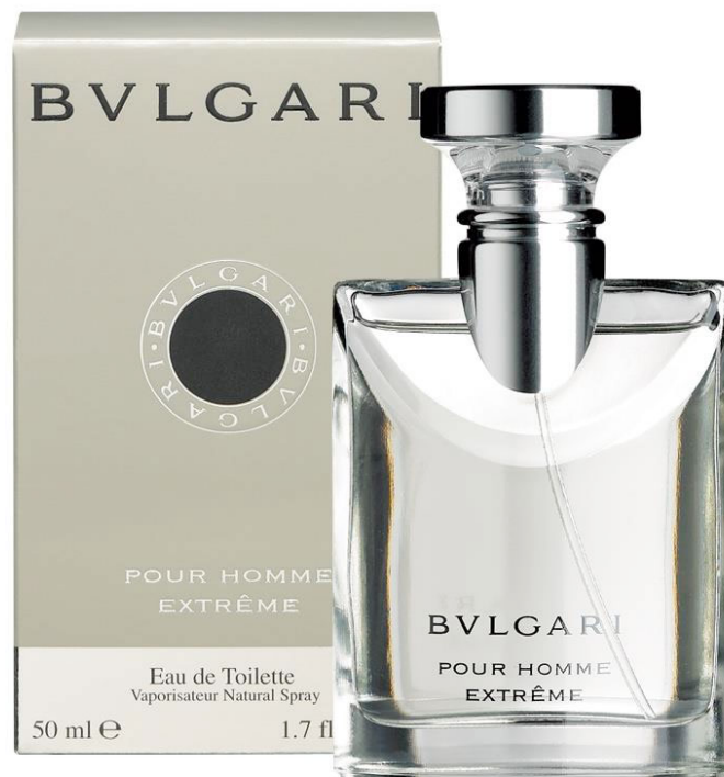
Slika 5: Pakiranje Bvulgari parfema za muškarce

Primjerice, Bvulgari parfem luksuzni je proizvod talijanskog porijekla. To je svjetsko poznati brand koji garantira kvalitetu svojih proizvoda, a to dokazuje i njegova cijena. Namijenjen je odraslim, muškim i ženskim osobama i apelira na stil života i luksuz koji si malo tko može priuštiti.