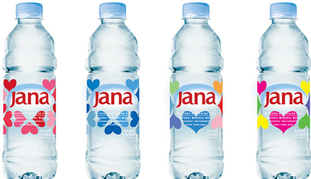
Slika 18: Bočice „Jana- voda s porukom“