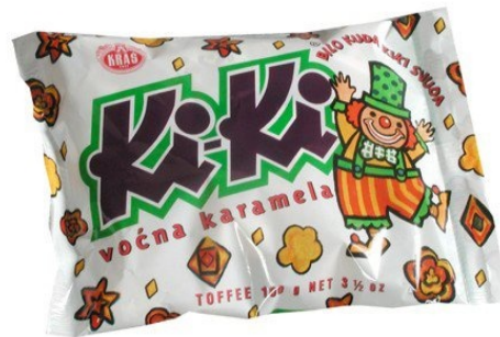
Slika 1: Starije pakiranje Ki-Ki bombona

Primjer pakiranja za djecu su Ki-Ki bomboni koji već generacijama osvajaju najmlađu populaciju svojim izgledom ali i okusom.