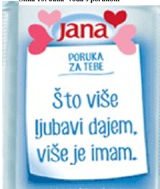
Slika 10: Jana- voda s porukom