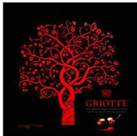
Slika 7: Pakiranje Kraš, Griotte bombonjere

Ovo su primjerice proizvodi čije pakiranje samo po sebi govori o njihovoj kvaliteti. Način na koji su dizajnirani pokazuje da su namijenjeni odraslim osobama.