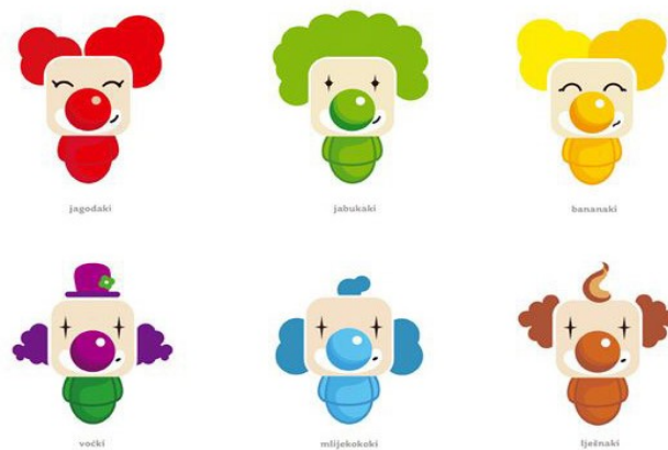
Slika 3: Najnoviji dizajn Ki-Ki klaunova

Kraš nije često mijenjao pakiranje proizvoda Ki-Ki bombona za djecu ali potrebe i interesi ciljane skupine porasli su pa se cijeli dizajn morao promijeniti, modernizirati. Ki-Ki je i dalje ostao klaun no sada više nije samo jedan klaun već šest novih, a svaki od njih ima ime i osobnost te predstavlja određeni okus pa djeca koja su vrlo različita mogu birati s kojim će se klaunom poistovjetiti. Jagodaki, Jabukaki, Bananaki, Vočki, Mlijekokoki i Lješnjaki su njihova imena koja su vrlo šaljiva i dobro zamišljena.