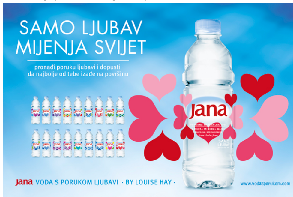
Slika 8: Novi projekt „Jana- voda s porukom ljubavi“

Ovogodišnji projekt „Jana- voda s porukom“ vođen je idejom da samo ljubav može promijeniti svijet, a limitirana edicija Jana- samo ljubav prenosi poruke ljubavi kao najvažnije i najsnažnije ljudske emocije. Poruke koje se prenose potpisuje autorica Louise Hay 39 , osnivačica pokreta samopomoći i začetnica ideje da pozitivnim stavom možemo promijeniti svoju stvarnost.