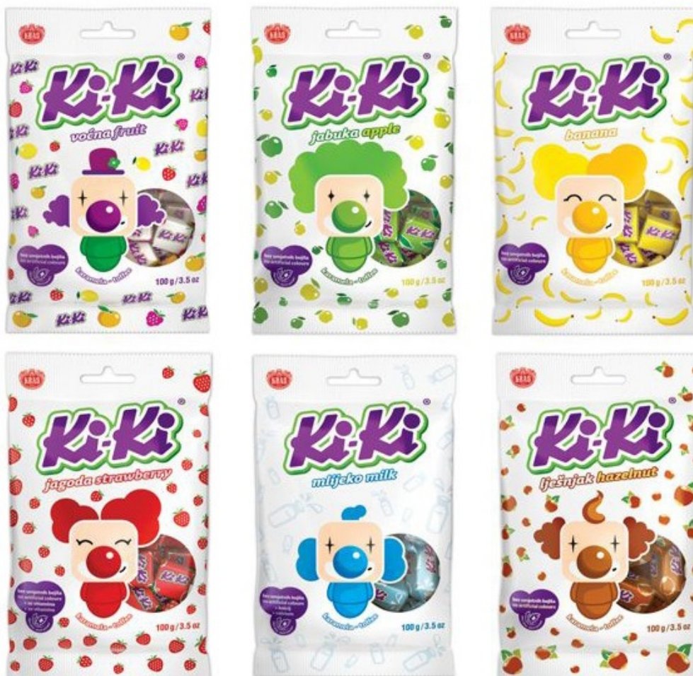
Slika 4: Najnoviji dizajn pakiranja Ki-Ki bombona

Pakiranje Ki-Ki bombona bazično je bijele boje što pridonosi urednosti cijelog sadržaja jer se na njemu nalaze otisnute sličice voćke od koje je bombon napravljen, a u središtu pakiranja je otisnuti veliki i uvijek nasmijani klaun. Pakiranje Ki-Ki bombona, uz sve to šarenilo, u sredini ima okrugli, prozirni otvor kako bi djeca mogla primijetiti da su njihovi omiljeni bomboni omotani u šarene papiriće što bi ih trebalo još više zainteresirati i potaknuti na kupnju.