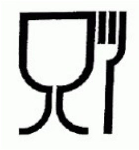
Slika 11: Ambalažna oznaka 1

Okomito ispod nalazi se barkod pored kojeg su sa njegove lijeve strane istaknuti sljedeći simboli: