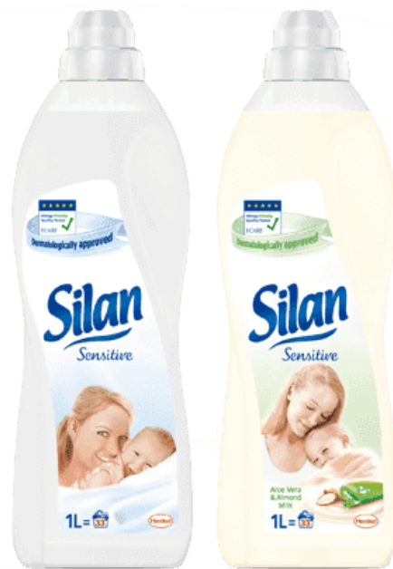
Slika 6: Pakiranje Silan sensitive omekšivača

Sljedeći primjer proizvoda također je namijenjen odraslim osobama ali apelira na potpuno drugačiji segment. Riječ je o omekšivaču rublja Silan sensitive. On je namijenjen majkama te apelira na sigurnost i njegu. Ističe da se njegovim korištenjem dobiva najmekše i najčišće rublje za njihove najmlađe.