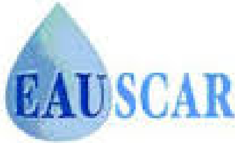
Slika 14: AquaExpo 2005

Na ovaj simbol „Jana- voda s porukom“ može biti posebno ponosna jer on znači da je Jana dobitnik prestižne nagrade EAUSCAR AquaExpo 2005. godine.