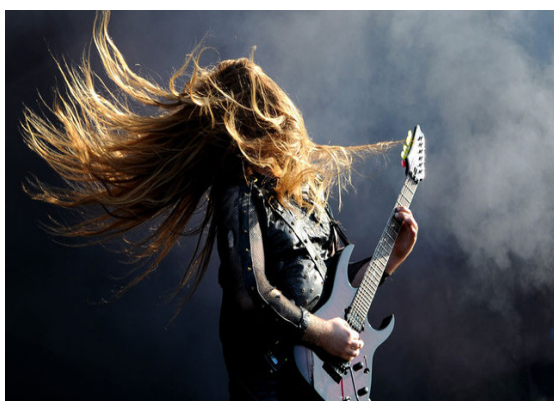
Slika3. Primjer heavy metalca- gitarist

Mnogi metalci su sudjelovali i u stadionskim ritualima, tvoreći jedan poseban crossover, neovisno o bendovima, s punkerima koji su se također hranili žestokom glazbom uoči utakmice. Tako su naši domaći akteri, metalci i punkeri, osim sukoba i evidentiranih tučnjava, započeli i zajednički „let me go“ ples na stadionu, možda i prije nego što su to mogli iskusiti na nekom crossover koncertu u gradu. Heavy metal je vezan i uz set muškasti, mistike i snage, sirove energije, uz život u stripu, umjetničku virtuoznost i usporedbu s klasičnom glazbom i vezan je uz stigme mačizma, konzervatizma, sotonizma, kako u dominantnoj kulturi, tako i na dijelu subkulturne scene. Bendovi koji se izdvajaju u ovom žanru su: Black Sabbath, Led Zeppelin, Iron Maiden, Judas Priest, Motörhead, Def Leppard i Saxon. 74