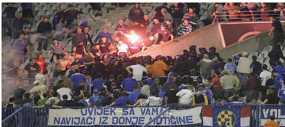
Slika 6. Primjer huliganizma navijača Torcide i Bad Blue Boys