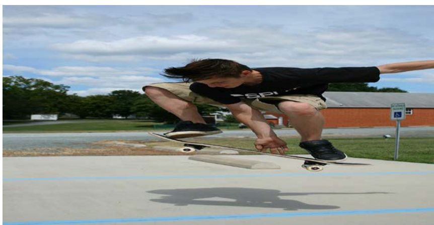
Slika 8. Skeate trik „Grab“