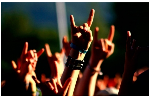
Slika 4. Haevy metal fanovi