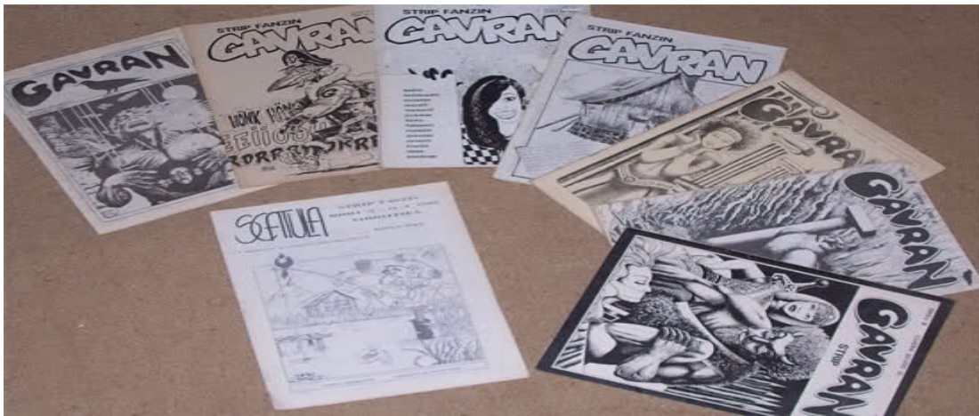
Slika 11. Primjer fanzina