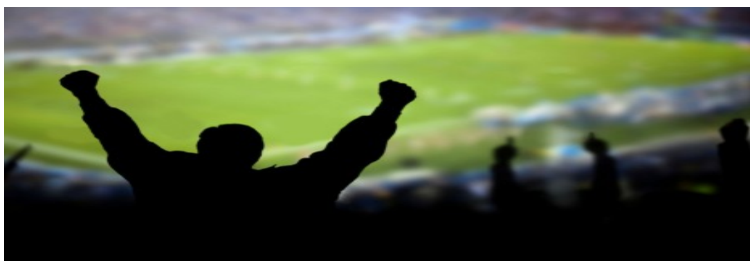
Slika 5. Primjer navijača

Postoje već standardna okupljališta na kojima se navijači nalaze prije samog početka utakmice, te mjesta za slavljenje pobjede nakon završetka utakmice. Konzumiranje alkohola tijekom svih tih aktivnosti vrlo je česta pojava. Konzumacija počinje prije početka utakmice, poslije se nastavlja na stadionu za vrijeme utakmice, a nakon utakmice završava u kafiću gdje se slavi pobjeda. Utakmica počinje predstavljati masovni spektakl koji se odvija na stadionima, gdje je dobro poznato na kojem se dijelu skupljaju navijači. Navijači na stadionima urlaju, pjevaju, sukobljavaju se s protivničkim stranama. Pomoću rekvizita i transparenta koje donose sa sobom na utakmice, lako se može prepoznati vlastiti klub. Kod nas u Hrvatskoj najprepoznatljivije navijačke skupine su Bad Blue Boys iz Zagreba i Torcida iz Splita. Upravo te dvije skupine predstavljaju huliganizam u Hrvatskoj, često se baš one međusobno sukobljavaju kada jedan klub igra protiv drugog.