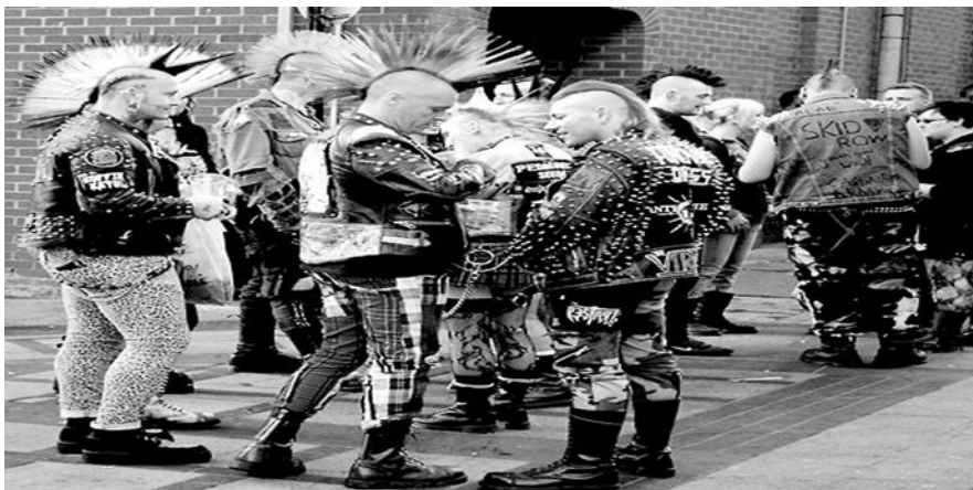
Slika 9. Skupina punkera

Drugi val – diferencijacija. U želji za promjenama prvo se rađa Oi! pokret koji je svojevrsni spoj skinhead i punk subkulture. Stilski elementi Oi! glazbe se sastoje od punk rocka i glazbe vezane uz navijačku subkulturu, folk glazbu (utjecaj nacionalnog ponosa) te pjesama vezanih uz alkohol i pubove. U sam izgled i odijevanje se unose karakteristike skinhead stila: martensice (koje prije nisu bile obavezno obilježje stila), vojnički stil, spitke, brijanje glava do kože, kožne jakne sa nitnama, t-shirt majice sa sastavima i drugo. Pokret zagovara jedinstvo punkera i skinheadsa te je druženje i osjećaj pripadnosti među potonjima najprirodnija stvar u ovoj supkulturi. Ovaj pokret je podosta percipiran na krivi način, najčešće kao nacistički pokret, skinhead pokret te nasilan i destruktivan oblik punka. Uz to, razvija se street punk, čiji izgled pripadnika agresivan te se sastoji od obojenih kožnjaka sa nitnama, velikih irokeza ili kose dignute u šiljke, puno bedževa, prišivaka, majice s natpisima bendova, lanci, uske traperice. Uz street punk razvija se i hardcore koji nije označavao ime definiranog muzičkog žanra. Hardcore bendovi su izrazito anti-komercijalni i usmjereni na underground djelovanje. Inspiriran hardcore-om kasnije se u određenom smjeru razvija anarho punk koji može ići u dva smjera. Česte riječi u pjesmama su chaos - haos, destruction - razaranje, disorder – poremećaj. 82