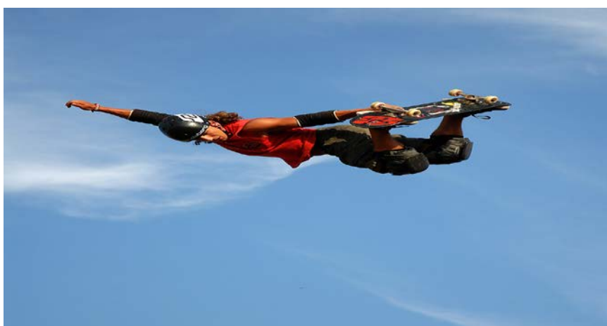
Slika 7. Skeate trik „Aerial“

Osim što je ekstremni šport, skateboarding može biti i rekreacija te način umjetničkog izražavanja. Često se povezuje s drugim urbanim subkulturnim aktivnostima, a neke od njih su: BMX biciklizam, grafiti, punk, grunge, hip hop itd. Također, daska za skejt može služiti i kao prijevozno sredstvo.