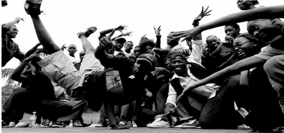
Slika 2. Break danceri

eskalacije navijačkog nasilja između navijača s jedne strane i navijača s druge strane, tj. između Boysa i Torcide, završavajući pjesmu psovkom u kojoj, ako se nasilna spirala ne može promijeniti, otpisuje i „vaše sinje more“ i „moje zagrebačko gorje“.