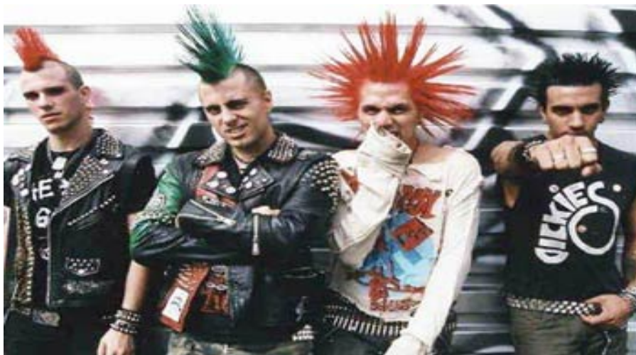
Slika 10. Punk bend The Casualties