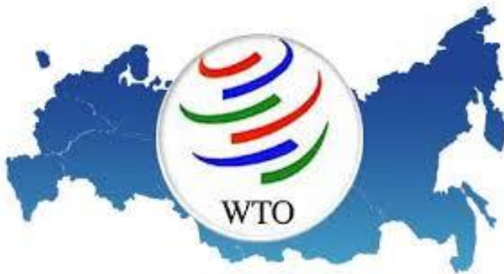
Slika br. 4 Simbol Međunarodne trgovinske organizacije