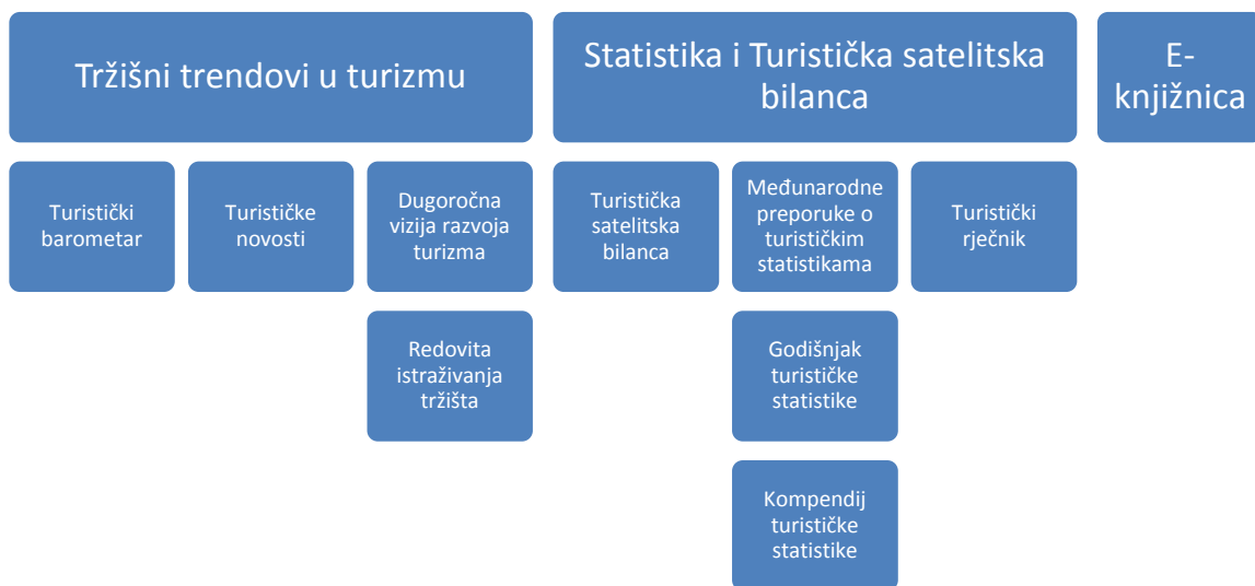
Slika br.3: Publicistička djelatnost UNWTO – a

U sljedećem poglavlju slijedi kratki pregled Svjetskog vijeća za putovanje i turizam te njegovo polje djelovanja.