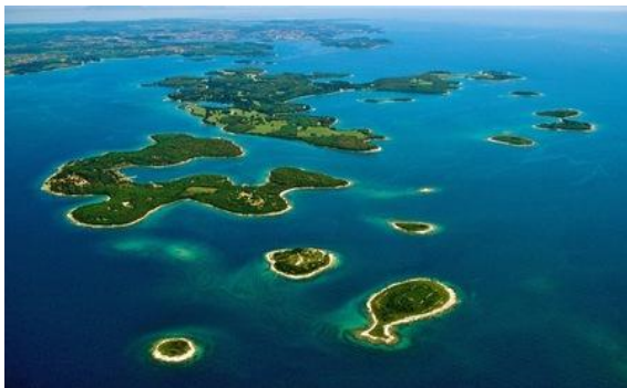
Nacionalni park Brijuni Fažana