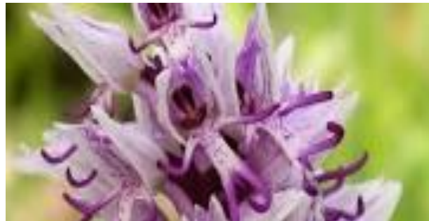
Orhideja na Kamenjaku u Premanturi