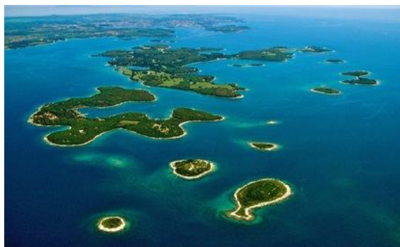
Nacionalni park Brijuni Fažana