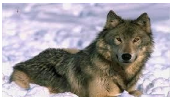
Vuk na području NP „Plitvička jezera“

Slika 1. Natura 2000, zaštićena područja i zaštićene vrste u Republici Hrvatskoj