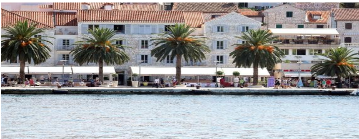
Slika 3.: Održivi turizam