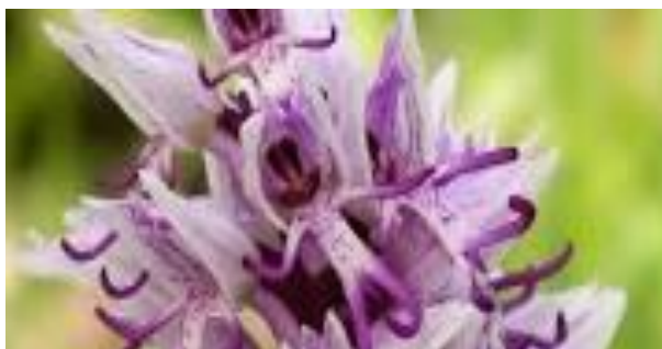
Orhideja na Kamenjaku u Premanturi