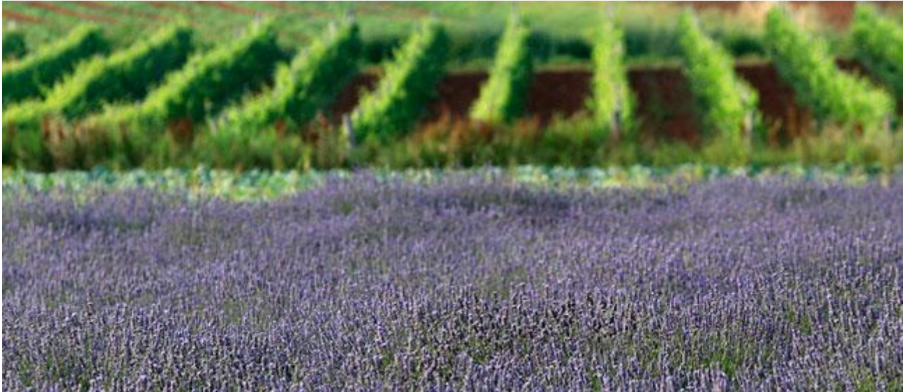
Slika 4. Održivi razvoj i zaštita okoliša u Istri