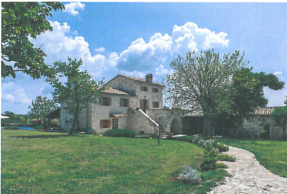
Slika 2. Obnovljena istarska stancija u općini Svetvinčenat