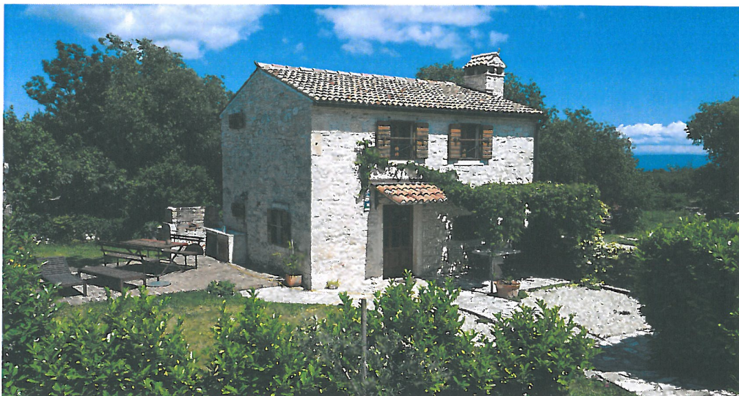
Slika 1. Primjer preuređene kamene kuće za odmor u Raklju