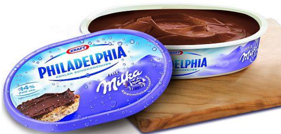
Slika 14. Philadelphia – Milka