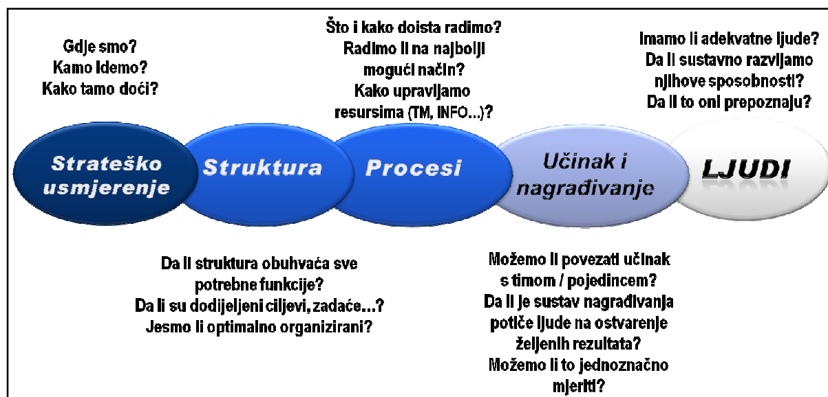
Slika 1. Pet "lakih" koraka organizacije