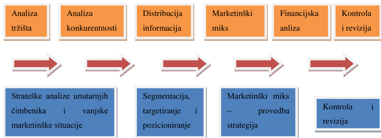
Slika 2. Strateški marketing