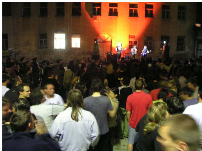
Slika 12. Koncert Made in Rojcu u unutarnjem dvorištu Rojca, 2008.

Međutim u kreativnom smislu, od 2001. do negdje 2005.-2006. bilo je zlatno vrijeme Rojca u smislu umjetničkog stvaralaštva. Funkcionirala su čak tri kluba, Metamedija, Monteparadiso i Studentski klub, s alternativnom kulturnom ponudom kao i brojnim bendovima, kazalištima, zajedničkim manifestacijama i sl. Cijeli taj zamah poslužio je kao osnova za nastanak drugih inicijativa, Pulske grupe, festivala FOPA, raznih koprodukcija i sl.