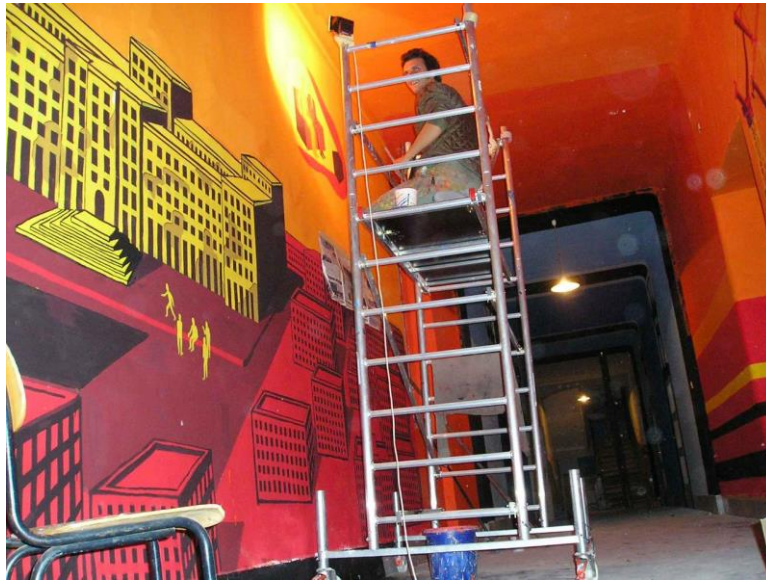
Slika 14. Projekt Krojčberg, oslikavanje zajedničkih prostora Rojca.

prostorija. U listopadu 2004. završena je prva faza projekta Krojčberg kojeg je pokrenula udruga Distorzija radi oslikavanja crtežima, muralima, unutarnje prostorije Rojca i povezivanja korisnika kroz rad umjetničkih radionica. Projekt je kasnije nastavljen u suradnji više udruga, Distorzij iz Pule i Otompotom iz Zagreba i kao takav je funkcionirao do 2012.