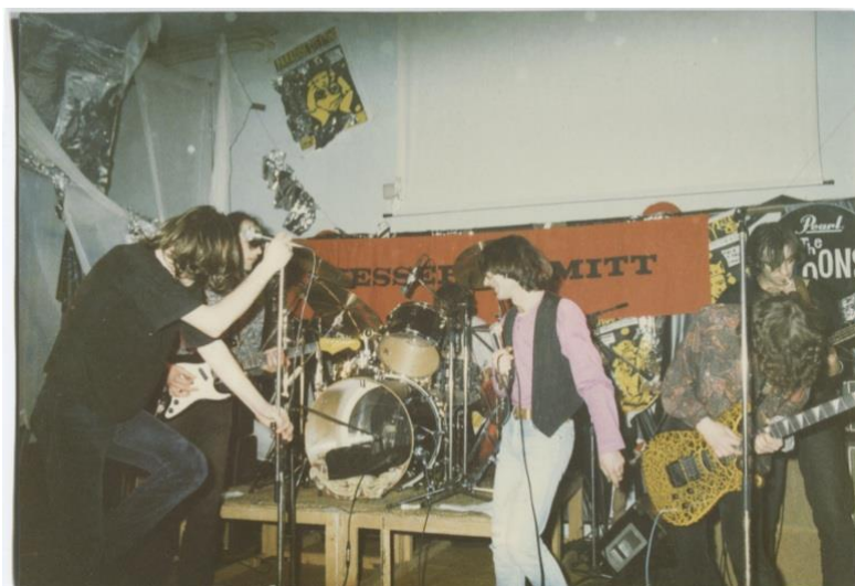
Slika 4. Koncert Messershmitta u Uljanika, jam session sa gostima iz Spoonsa, 1990. na Paradise cityju.