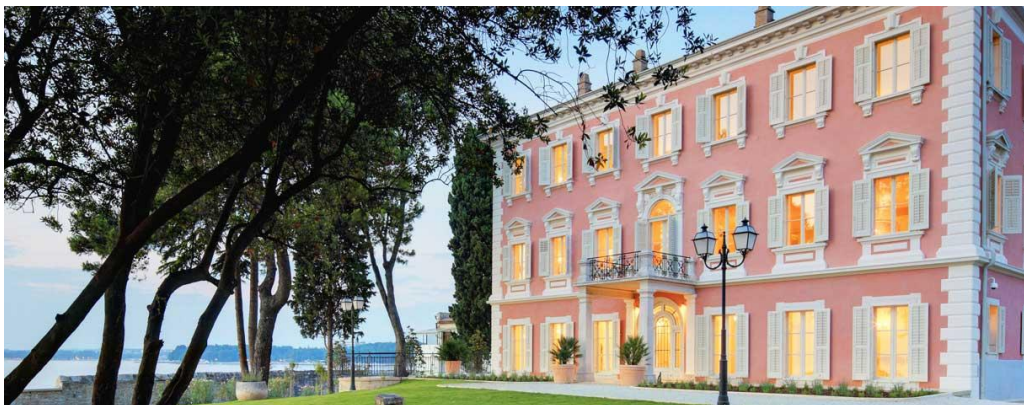
Slika 3. Villa Polesini, Poreč