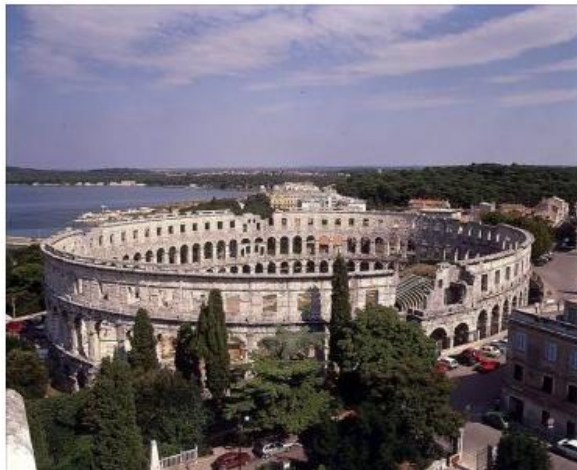
Slika 2. Arena, Pula