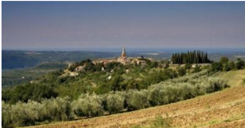
Slika 6. Grožnjan, Istarska županija