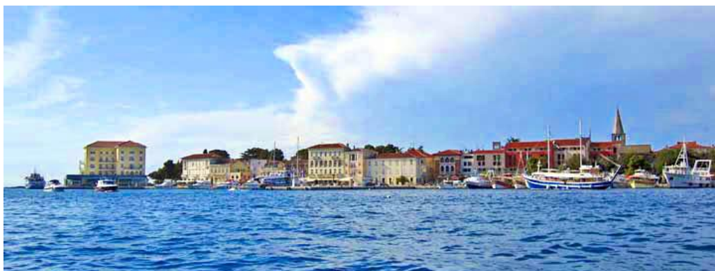
Slika 4. Grad Poreč