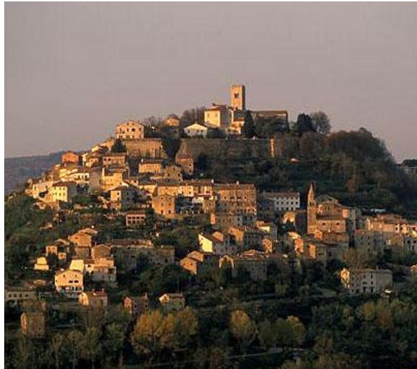
Slika 7. Motovun, općina Motovun