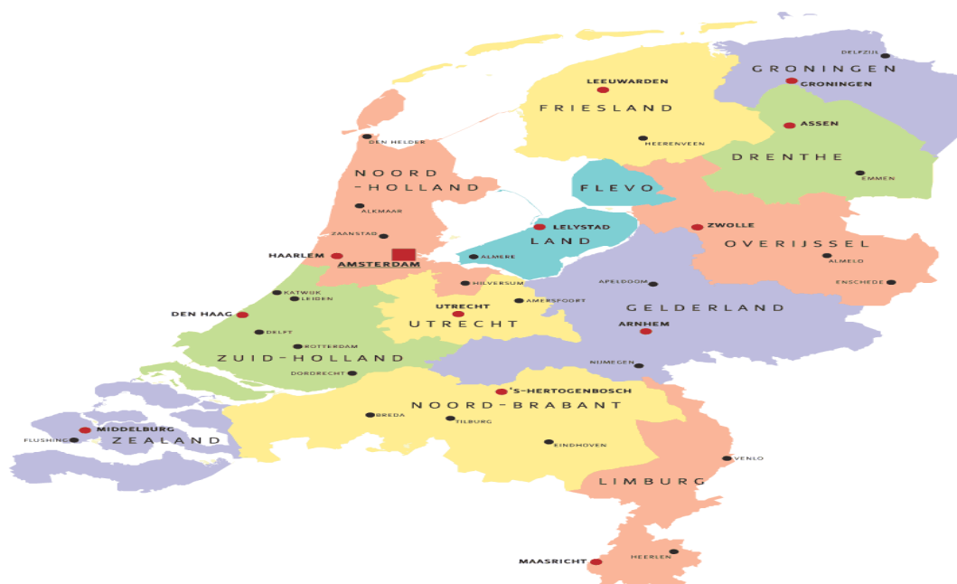
Slika 3. Regije Nizozemske