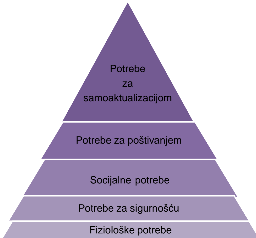
Shema 1: Maslowljeva hijerarhija potreba