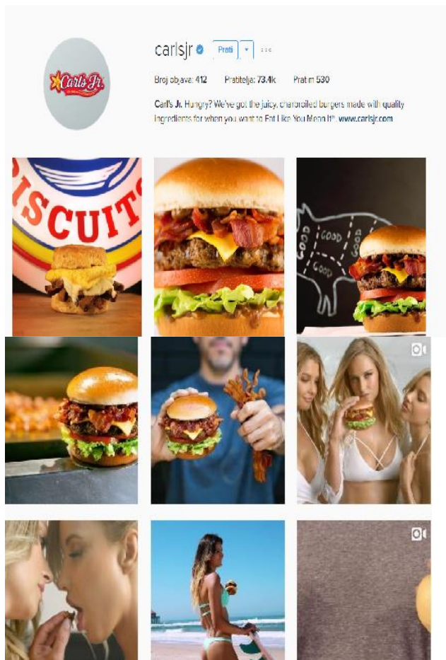
Slika 7. Instagram profil Carl's Jr.-a