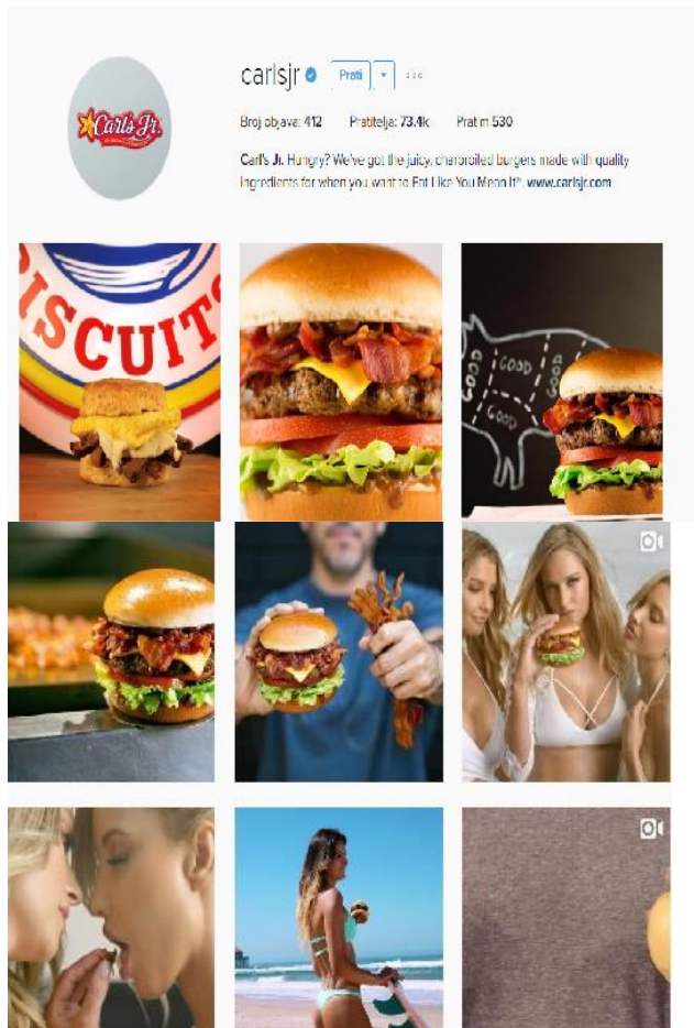
Slika 7. Instagram profil Carl's Jr.-a