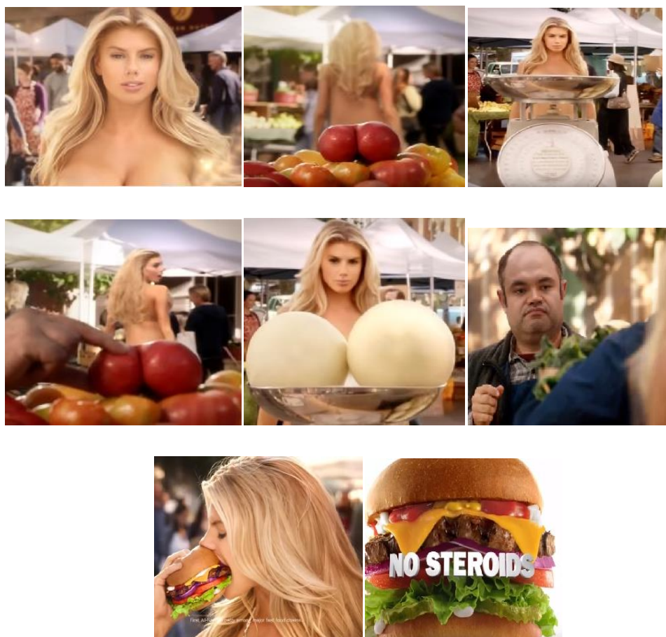
Slika 6. Kadrovi televizijskog spota za Carl's Jr.