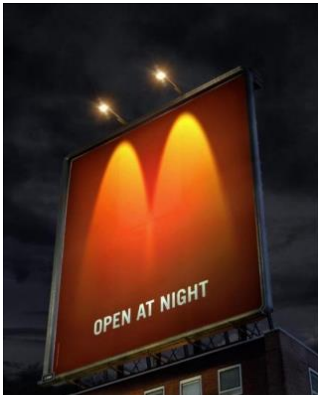
Slika 4. Jumbo plakat Mc Donald's-a