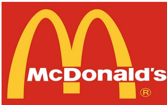
Slika 1. Mc Donald's-ov logo