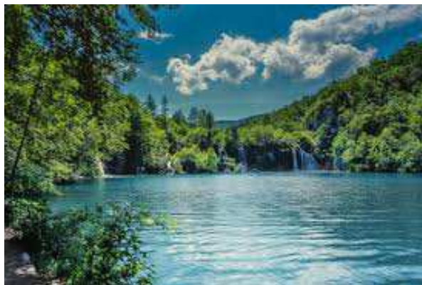
Slika 3. Prošćansko jezero

Plitvička jezera se sastoje od 16 međusobno povezanih jezera između Male Kapele i Plješivice u Lici, što znači da se nacionalni park nalazi u dvije županije i to u Karlovačkoj i Ličko-senjskoj županiji. Jezera se dijele na gornja jezera kojih ima 12 (Prošćansko jezero, Veliko jezero, Malo jezero, Vir...) i na donja jezera kojih ima 4 (Milinovac, Gavanovac, Kaluđerovac i Novakovića Brod), a stara su i do desetak tisuća godina. Od navedenih jezera najviše je Prošćansko jezero (Slika 3.) sa 693 m, a najniže je Novakovića Brod s 503 m. Gornja jezera nastaju stvaranjem sedra (mjesto gdje voda pada s neke visine) i bogata su šumom, dok donja jezera nastaju urušavanjem svodova nad podzemnim šupljinama te su ona izražena kršom sa strmim obalama. U samom nacionalnom parku postoji 36 špilja i ponora, a u blizini jezera se nalaze njih 20. Neke od tih špilja tek danas počinju nastajati. Zahvaljujući prirodnim ljepotama kojima su bogata Plitvička jezera, upravo su ona postala prvi nacionalni park u Hrvatskoj proglašen 08. travnja 1949. godine. 1979. godine Plitvička jezera su uvrštena u popis Svjetske prirodne baštine.