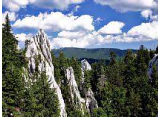
Slika 2. Strogi rezervat Bijele i Samarske stijene