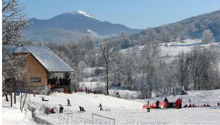
Slika 4. Skijalište i sanjkalište Mukinje

ih godina u turističku ponudu uključeno je skijanje. Skijalište je smješteno u naselju Mukinje (Slika 4.).