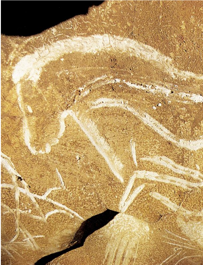
Slika. 4. Veliki konjski panel, špilja Chauvet, Francuska.

Na jednoj od slikarija iz špilje Chauvet prikazana je scena s lavovima, velik dio zida koji se nalazi desno od središnjeg udubljenja ima velik broj oslikanih životinja. Iz orinjačkog je razdoblja. Cjelokupna scena prikazuje lov. S desne se strane nalaze nosorog i mamut. S lijeve strane, tu su i četiri glave bizona, i dva nosoroga. Prikazano je sedam bizona koje ponosno goni šesnaest lavova. Prije cijele ove drame, u različitim razmjerima, vidi se lice lava mladunčeta. Gotovo sve životinje na ovoj podlozi si liče. Ovaj sastav je jedinstven u paleolitičkoj umjetnosti. 40