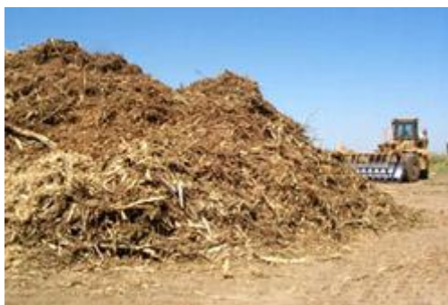
Slika 5. Biomasa od drvnih ostataka

Primjena energije iz biomase (uglavnom ogrjevnog drva i drvnog ostatka) u Hrvatskoj ima dugu tradiciju pa se tako još 1960. godine iz biomase zadovoljavala gotovo \frac{1}{4} ukupnih potreba za energijom. Danas Hrvatska zbog netehničkih prepreka: pomanjkanja tržišta za energiju iz biomase te nedostatka svijesti o prednostima takve proizvodnje, primjenom biomase pokriva samo mali dio svojih potreba za energijom, ostavljajući tako neiskorišten značajan prirodni potencijal. To je osobito vidljivo kada se današnje stanje usporedi s nekim europskim zemljama koje su po svojim značajkama slične Hrvatskoj. Također valja uočiti kako se energija iz biomase, odnosno drva, u Hrvatskoj većinom proizvodi na tradicionalan način, pri čemu se koriste energetske neučinkovite tehnologije. Dodatnu poteškoću predstavljaju uznapredovala plinifikacija i prelazak nekih drvnoprerađivačkih pogona za nove tehnologije. Iako su obje pojave same po sebi pozitivne, jedna od njihovih posljedica jest i sve veća količina neiskorištene drvene biomase. Drvena biomasa koja nužno nastaje pri proizvodnji u pogonima drvnoprerađivačke industrije ili pri redovitim radovima u šumi predstavlja vrijedan izvor energije koji može postati i problem za okoliš i za gospodarstvo, ako se zanemari njezina primjena. U Hrvatskoj je drvo od davnina služilo kao izvor energije, a u ruralnim područjima ono i danas predstavlja važan izvor pa je tako njegov udio u ukupnoj potrošnji energije 1996. godine iznosio 4,6%. 25