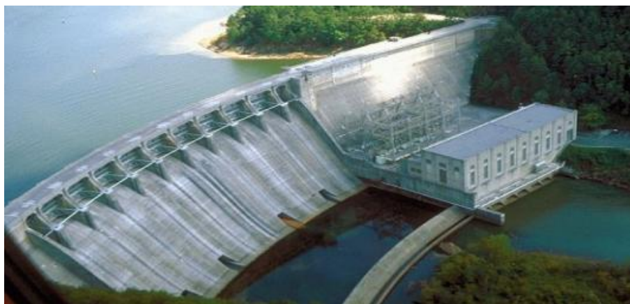
Slika 4. Hidroelektrana u Hrvatskoj

Krajem 2010. godine u Hrvatskoj, u sastavu HEP-a ima 18 velikih HE, 8 malih HE, snage do 10 MW, a izvan sustava HEP-a još je 6 malih HE. Među velikim hidroelektranama pretežu akumulacijske, ima ih 11, a protočnih elektrana je sedam. Omjer akumulacijskih HE spram potočnih je vrlo povoljan, akumulacijske omogućuju iskorištenje vode bolje prilagođeno potražnji. Pogotovo su korisne crpno-akumulacijske HE koje omogućavaju pohranu energije u doba male potražnje i proizvodnju energije u doba povećane potražnje. Jedna je takva velika ((Velebit). Ukupna instalirana snaga velikih hrvatskih HE je 2108 MW, a dodavši i male HEP-ove i one izvan HEP-a, ukupno je hidroelektrana instalirano 2141 MW. Instalirana snaga hidroelektrana, činila je 2010. godine polovinu ukupne instalirane snage svih elektrana na području Hrvatske. U razdoblju 1990-2011. godine ukupni park hidroelektrana bio je gotovo stalan, uz dogradnju s nekoliko malih HE i izgradnju HE Lešće 2010. godine. 19