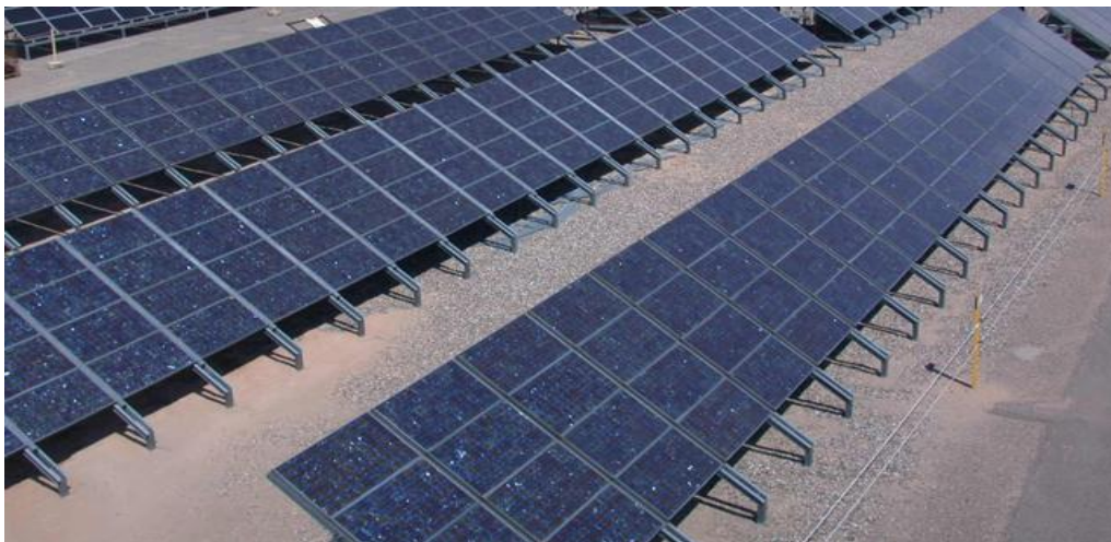
Slika 2. Fotonaponski solarni sustav

Zimi, u priobalnim dijelovima Hrvatske fotonaponski moduli mogu osigurati oko 160 W/h električne energije, a u ljetnim mjesecima i do 1000 W/h dnevno. U kontinentalnim dijelovima zimi to prosječno iznosi oko 120, a ljeti do 900 W/h dnevno. Ta gotovo besplatna i obnovljiva energija pohranjuje se u odgovarajuće akumulator bez buke i zagađivanja okoliša, a dostatna je za napajanje kućanskih trošila u opsegu uobičajene dnevne uporabe. U slučaju povećanih energetske potreba takav se sustav jednostavno proširuje nadogradnjom dodatnih fotonaponskih modula. 10