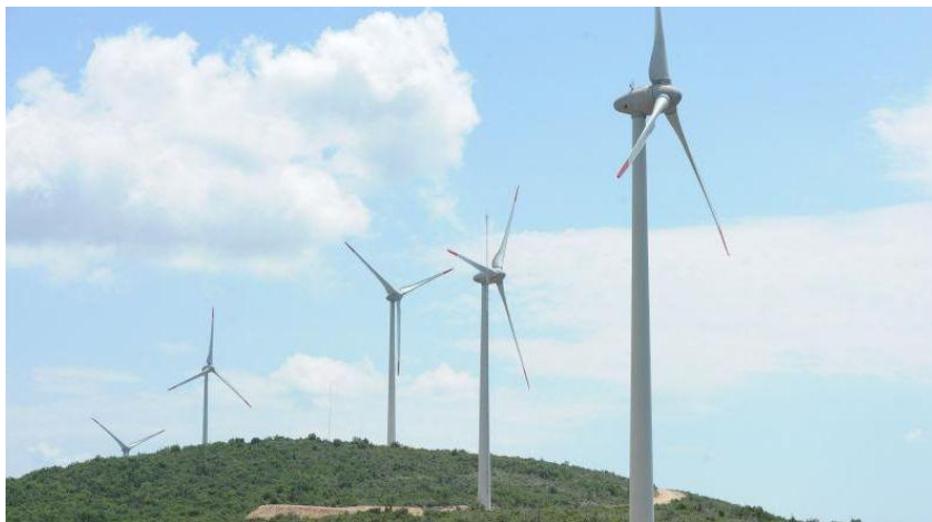
Slika 3. Vjetroпарк kod Splita

Financijska procjena projekta izgradnje vjetroelektrana može se podijeliti na procjenu likvidnosti i procjenu rentabilnosti. Procjena likvidnosti podrazumijeva predviđanje o tome hoće li VE cijelog vijeka trajanja moći podmirivati rashode, dok se procjena isplativosti temelji na određivanju njezinog ekonomskog doprinosa. Procjena isplativosti može se provesti na nekoliko osnovnih načina: metodom razdoblja povrata ulaganja (utvrđuje vrijeme potrebno za pokrivanje ukupnih ulaganja), metodom neto sadašnje vrijednosti i na temelju interne stope povrata. 15