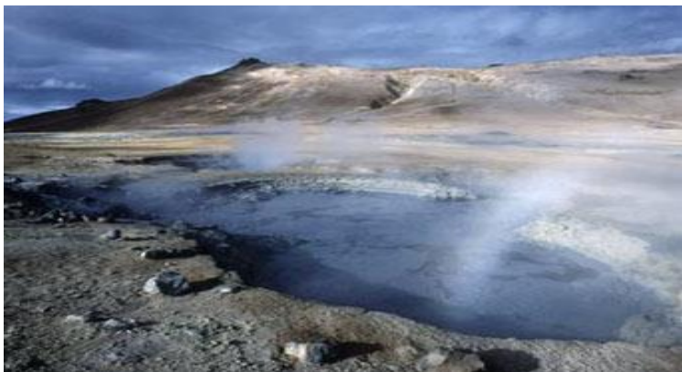
Slika 6. Izvor vruće vode na Islandu podoban za iskorištavanje geotermalne energije