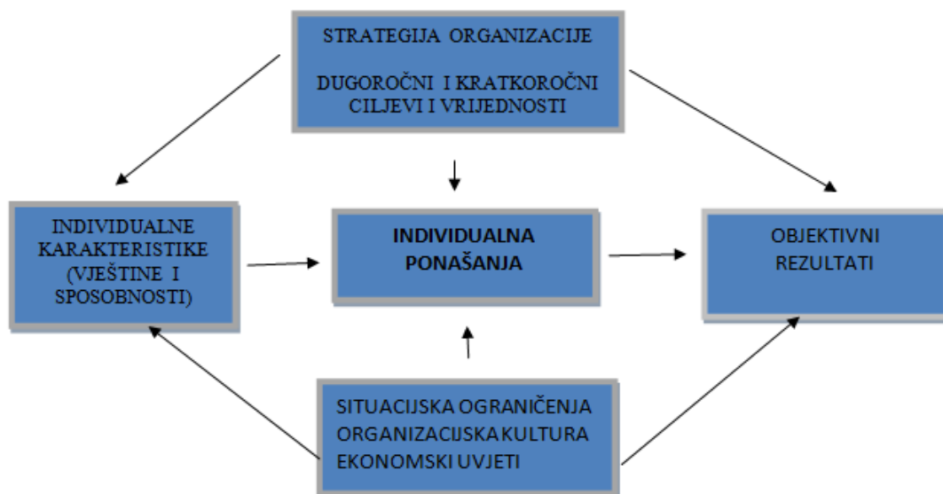
Slika broj 2.: Model upravljanja uspješnošću u organizacijama

Izradila autorica prema: Noe, R.A; Hollenbeck, J.R; Gerhart, B; Wright, M.P. (2006), Menadžment ljudskih potencijala. Mate d.o.o., str.277