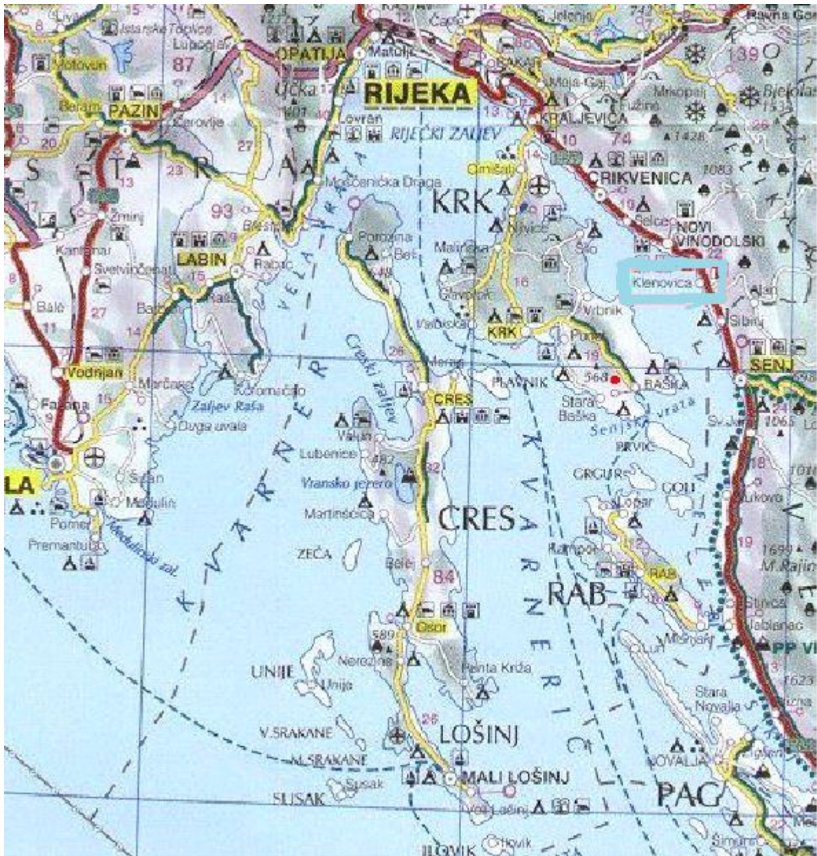
Slika 1. Akvatorij kvarnerskog područja