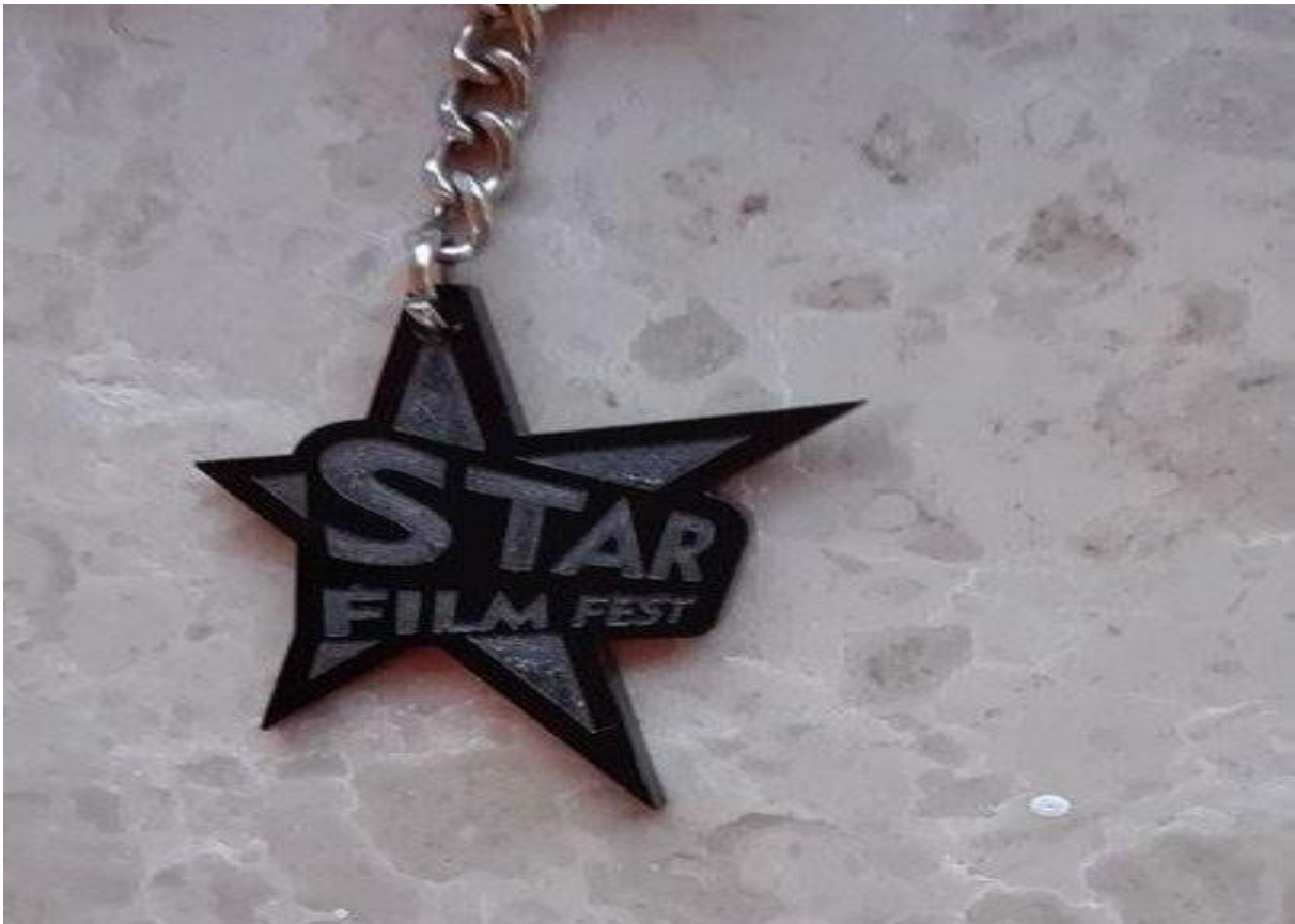
Slika 6. Promotivni oglas Star Film Festa

Baloni su bili namijenjeni najmlađim generacijama, ali nisu samo uveseljavali iste, nego su donijeli osmijehe i na lica starijim generacijama, koje su uživale ne samo u balonima nego i u privjescima koji su im bili poklonjeni.