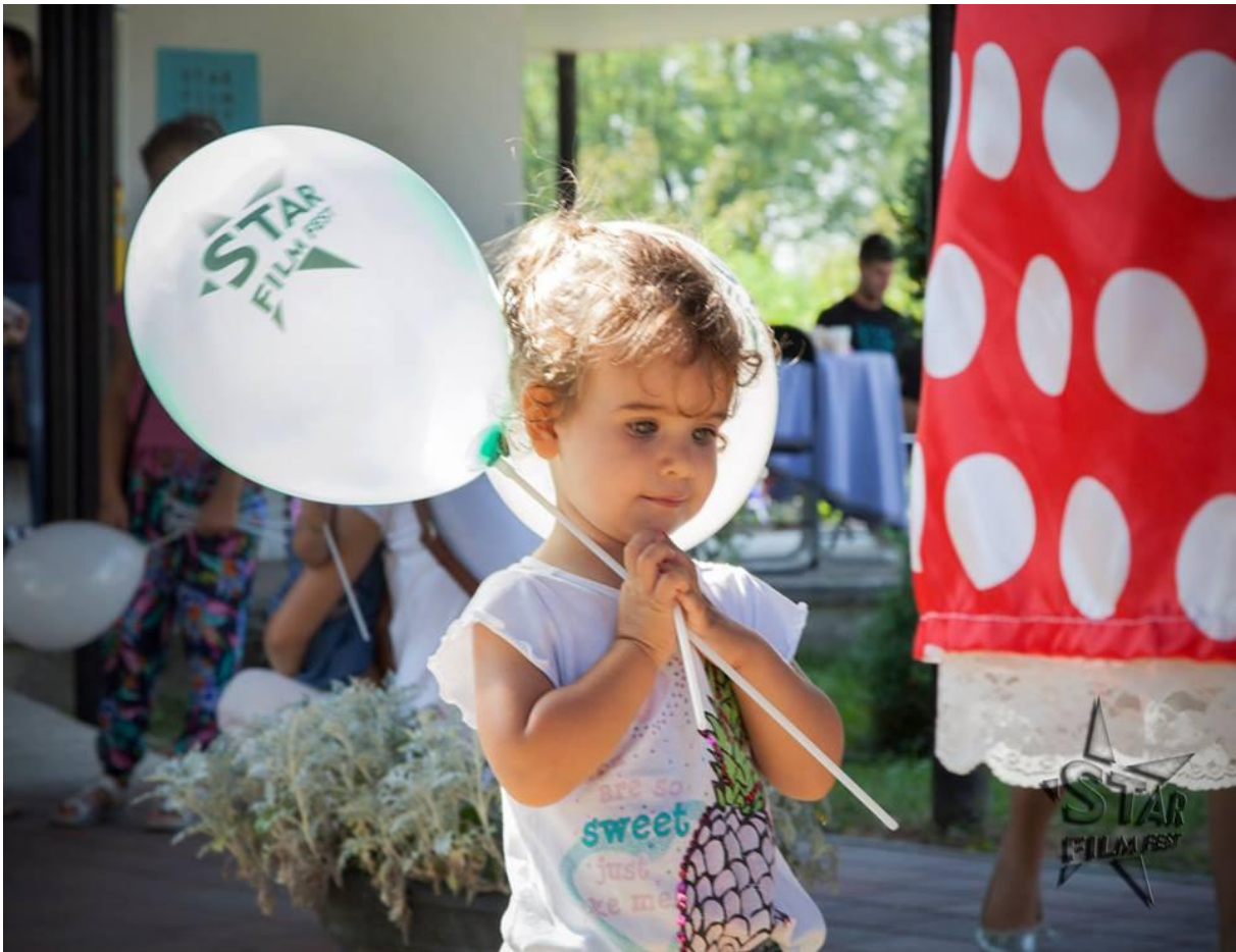
Slika 4. Promotivni oglas Star Film Festa