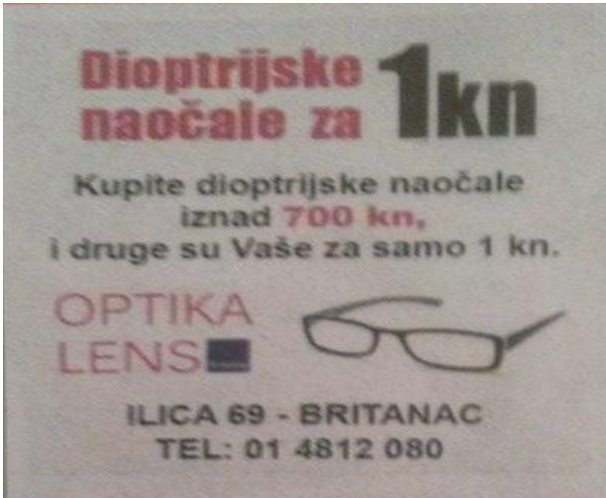
Slika 1. Oglas za dioptrijske naočale