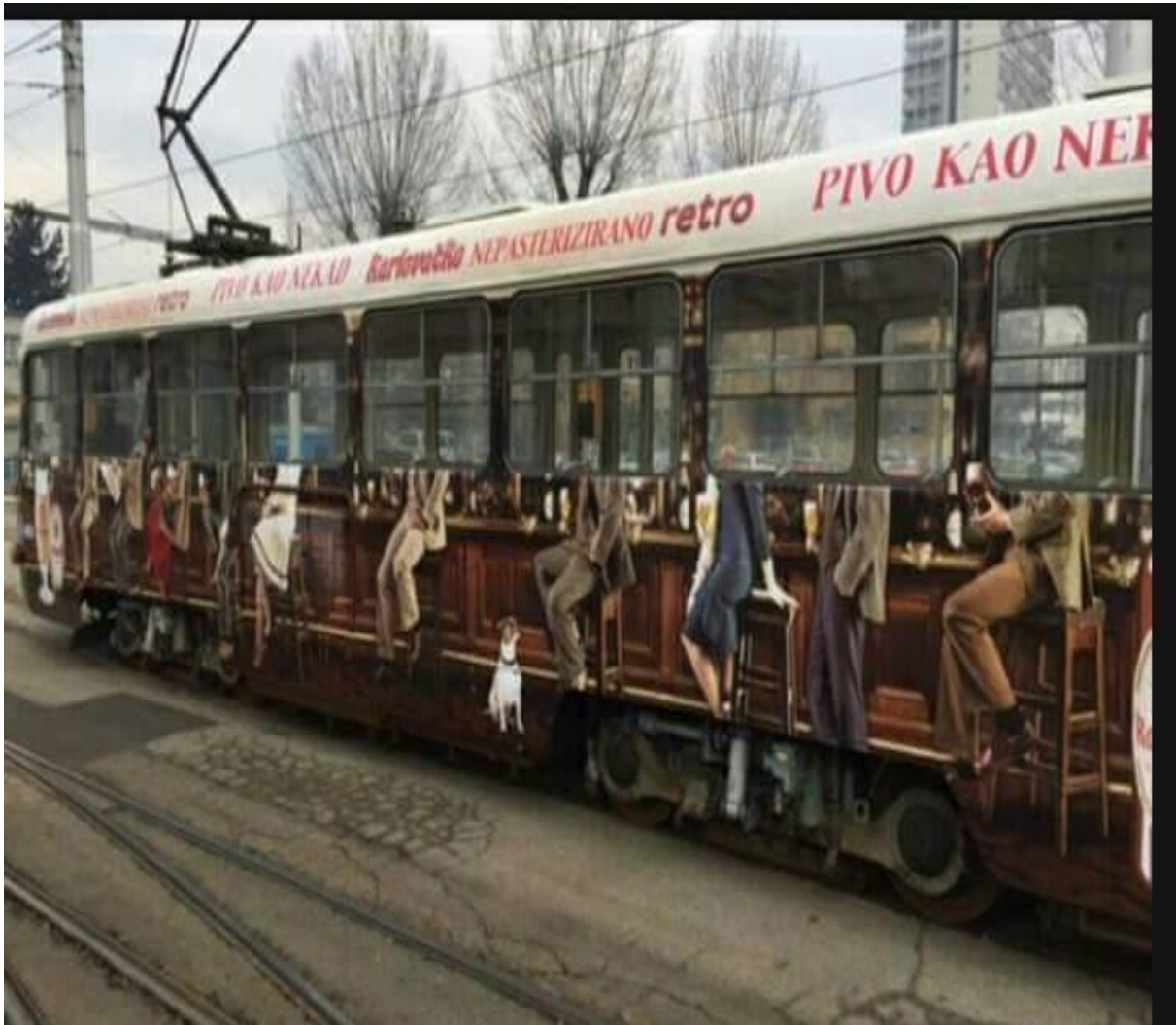
Slika 7. Oglas Karlovačkog Retro