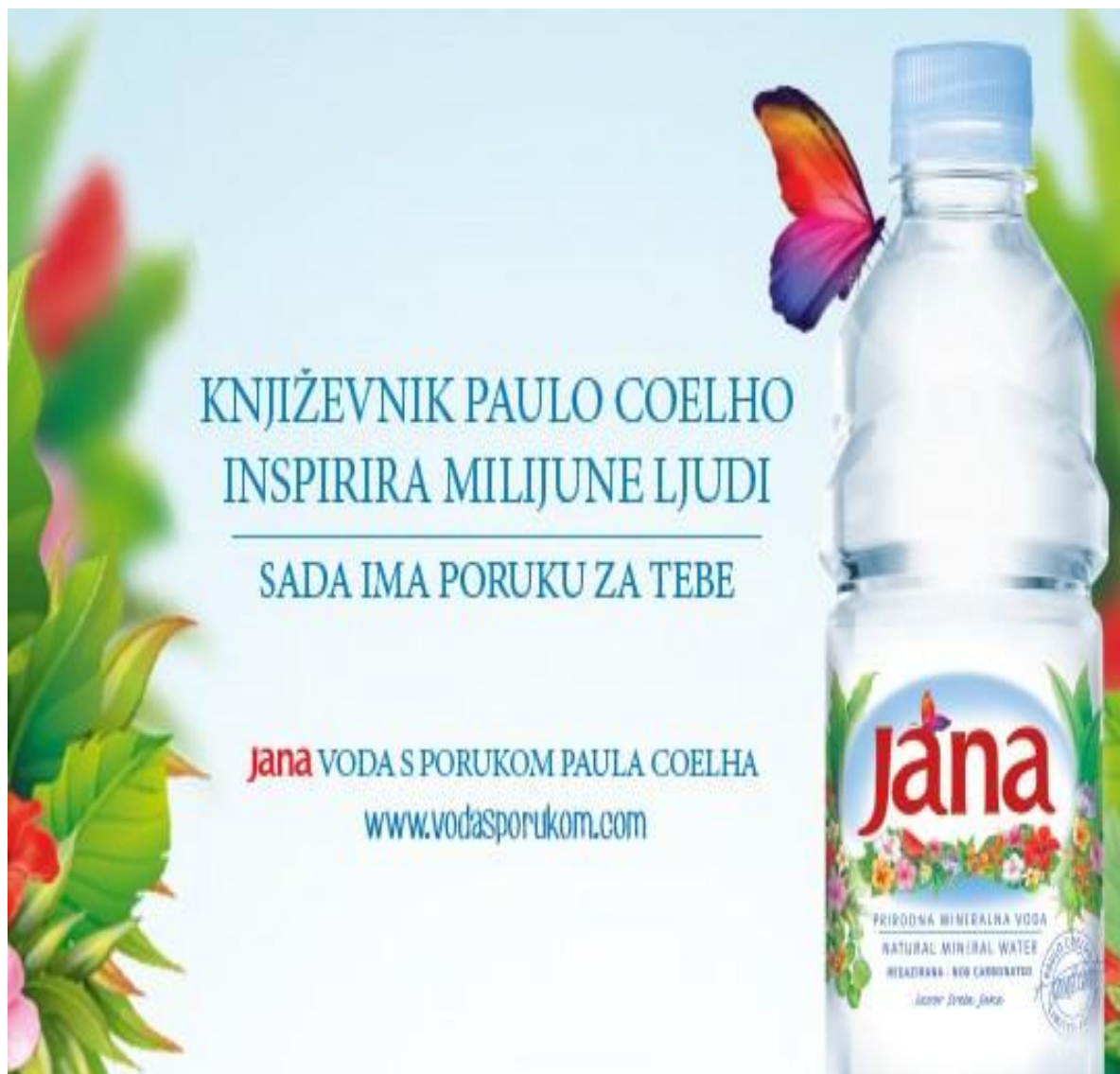
Slika 2. Oglas za prirodnu mineralnu vodu Jana