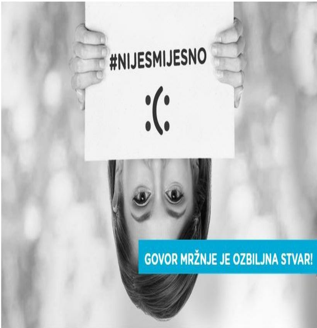
Slika 11. Oglas za kampanju protiv govora mržnje na internetu