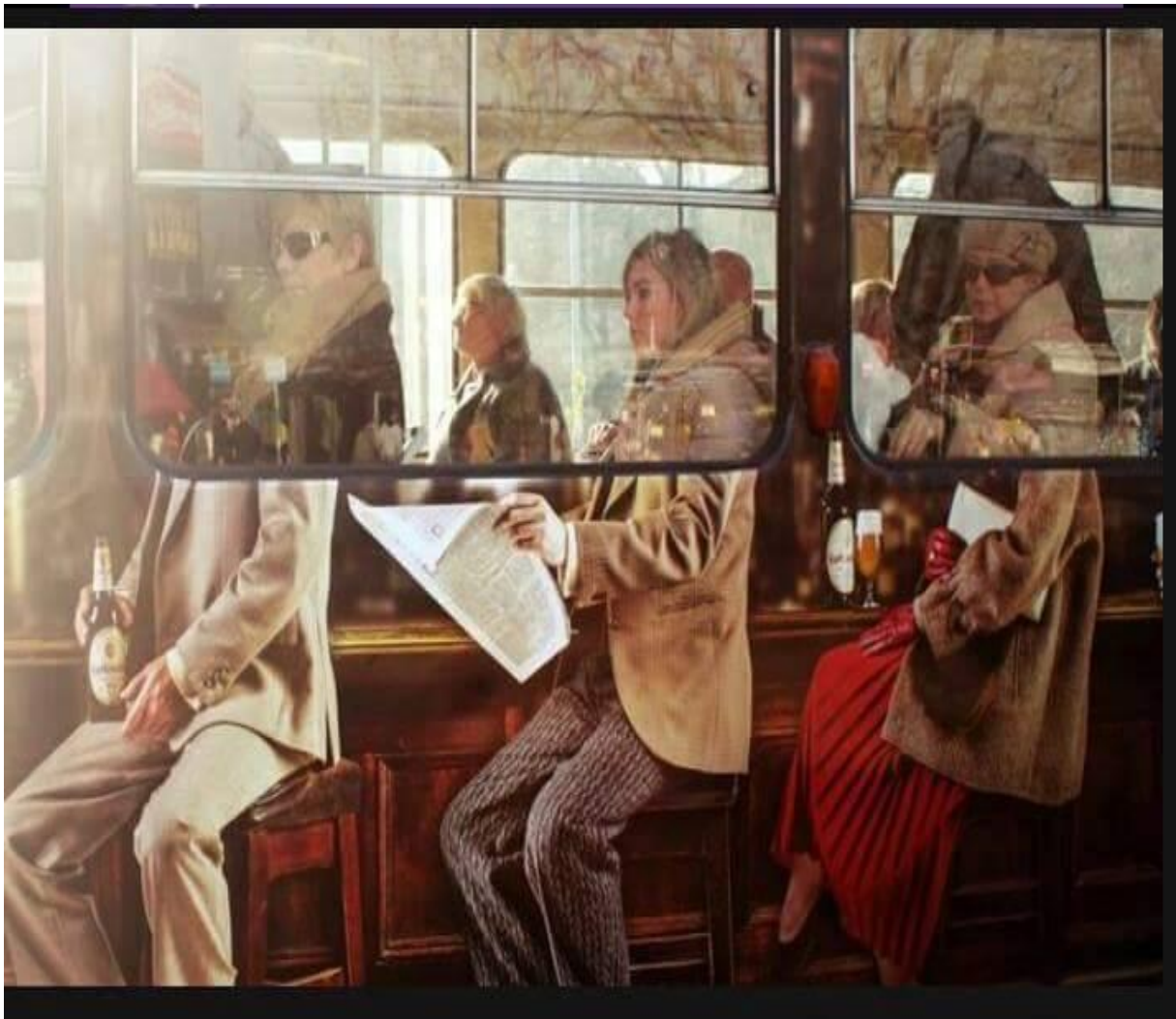
Slika 8. Oglas Karlovačkog Retro