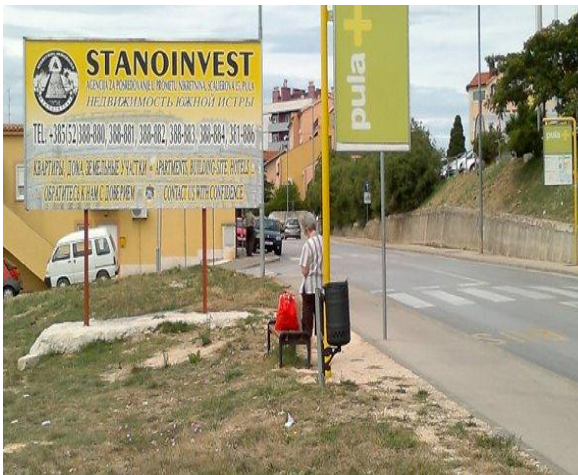
Slika 3. Oglas agencije za posredovanje nekretnima