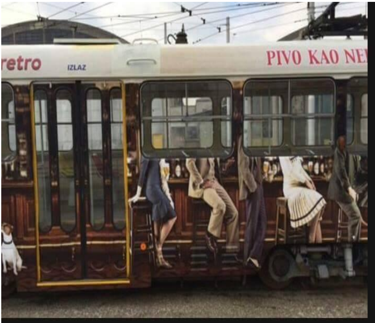
Slika 9. Oglas Karlovačkog Retro