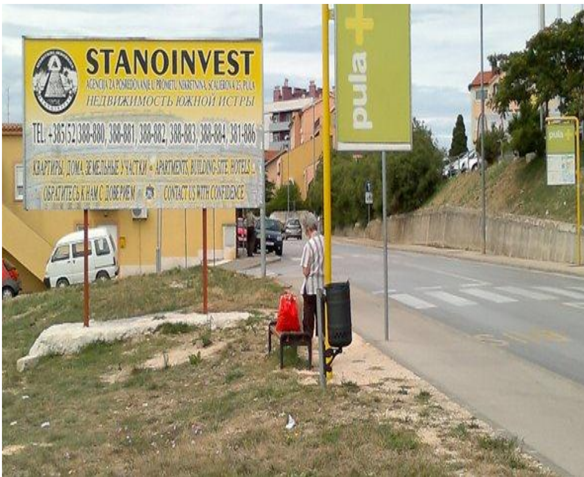
Slika 3. Oglas agencije za posredovanje nekretninama