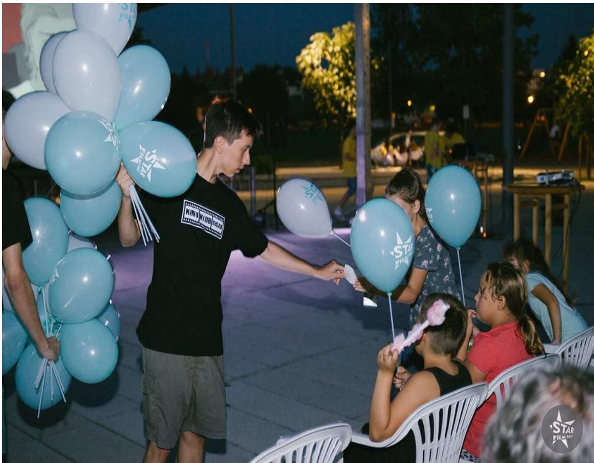
Slika 5. Promotivni oglas Star Film Festa