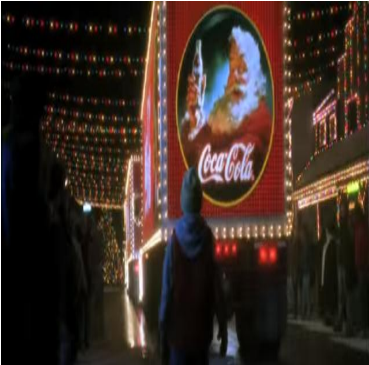
Slika 10. Oglas Coca Cole