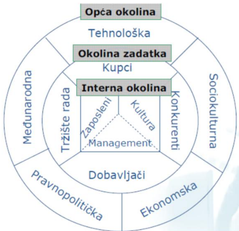
Slika 1. Okruženje poduzeća