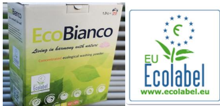
Slika 7: Prvi hrvatski proizvod kojem je dodijeljen znak EU Ecolabel, deterdžentu EcoBianco