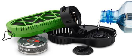
Slika 1: Power Trekk punjač