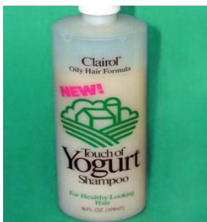
Slika 3: Šampon „Touch of Yogurt“

Izvor: https://supplier.community/the-consumer-graveyard-touch-of-yogurt-shampoo/ , (14.11.2016)