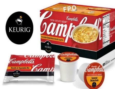
Slika 2: Primjer uspješnog proizvoda, Campbell juhe