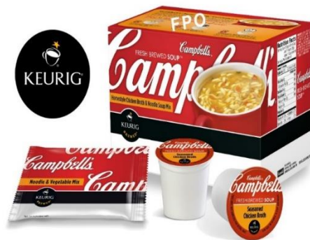
Slika 2: Primjer uspješnog proizvoda, Campbell juhe