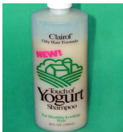
Slika 3: Šampon „Touch of Yogurt“