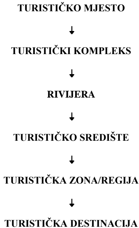
Slika 1. Izvorište pojma turistička destinacija