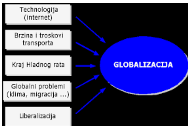
Slika 1. Uzroci nastanka globalizacije