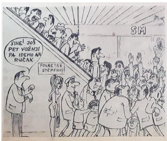
Slika 4: Pokretne stepenice, Supermarket, Glas Slavonije , 1967.

Supermarket je skoro izgorio 1973., no zahvaljujući noćnom čuvaru tragedija je izbjegnuta ovoga puta, no ne i 1982. kada je doista izgorio. 119 Supermarket je privlačio potrošače zbog svoga širokog asortimana, ali i jeftinijih cijena. Cijene su bile najniže u gradu, posebice mesa kao što je to bila svinjetina, junetina i govedina. 120 Usluge i prodavaonice koje su se mogle naći upotpunilo je otvaranje pošte koja je obavljala sve poštanske usluge, osim primopredaje paketa. Pošta nije mogla biti otvorena prilikom otvaranja jer nije bila predviđena planom. Naknadno je uvedena javna govornica i preinake vezane za osiguranje poštanskih pošiljaka. 121