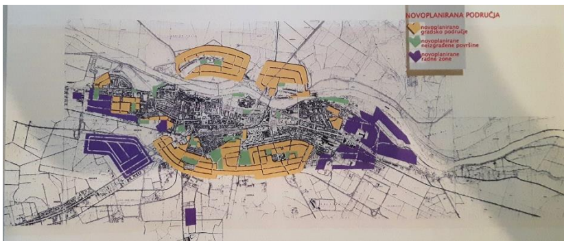
Slika 2: Urbanistički plan iz 1960., Jukić i Pegan.

tijekom godina došlo do odstupanja u gradnji i promjena u namjeni površina određenih generalnim planom. Naime, neka prometna rješenja, lokacije pojedinih industrijskih postrojenja i bespravno izgrađenih naselja uvjetovali su znatna odstupanja od prvobitnih ideja. Jedna od ideja revizije generalnoga urbanističkog plana bilo je razmatranje širenja grada na lijevu obalu Drave. Naime, do tada se Osijek razvijao na zapad i istok, a krajem 1960-ih nešto malo na jug. Urbanisti su se nadali kako će u budućnosti na lijevoj obali Drave izrasti grad s 80 000 stanovnika. 49