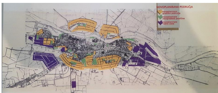
Slika 2: Urbanistički plan iz 1960., Jukić i Pegan.

tijekom godina došlo do odstupanja u gradnji i promjena u namjeni površina određenih generalnim planom. Naime, neka prometna rješenja, lokacije pojedinih industrijskih postrojenja i bespravno izgrađenih naselja uvjetovali su znatna odstupanja od prvobitnih ideja. Jedna od ideja revizije generalnoga urbanističkog plana bilo je razmatranje širenja grada na lijevu obalu Drave. Naime, do tada se Osijek razvijao na zapad i istok, a krajem 1960-ih nešto malo na jug. Urbanisti su se nadali kako će u budućnosti na lijevoj obali Drave izrasti grad s 80 000 stanovnika. 49