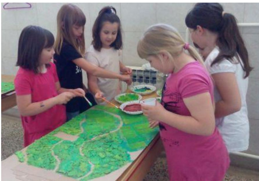
Slika 3. Proces nastanka slikovnice – 2.