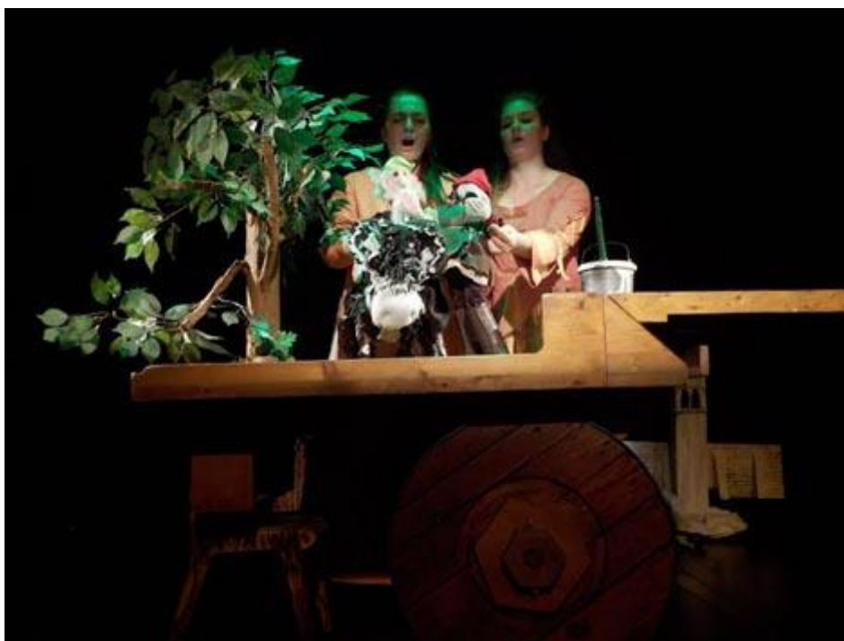
Slika 7. Veli Jože u izvedbi „Teatra Naranča“ – 2.