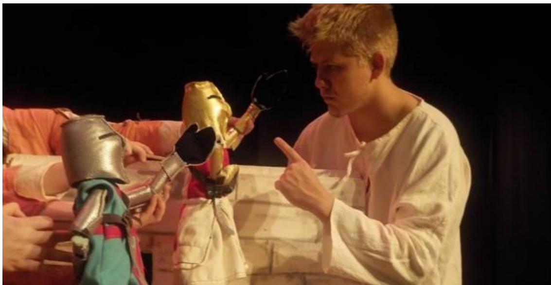
Slika 8. Veli Jože u izvedbi „Teatra Naranča“ – 3.