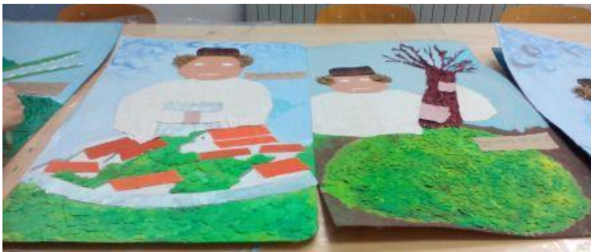
Slika 4. Završni izgled radova