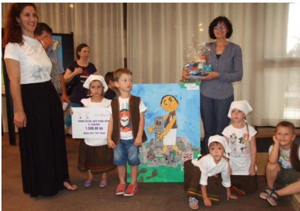
Slika 16. Dječji vrtić "Tići" iz Vrsara