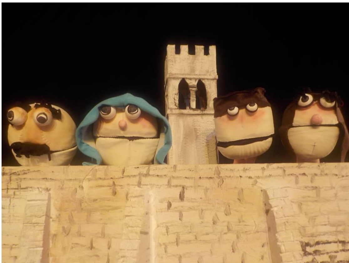
Slika 9. Veli Jože u izvedbi „Teatra Naranča“ – 4.