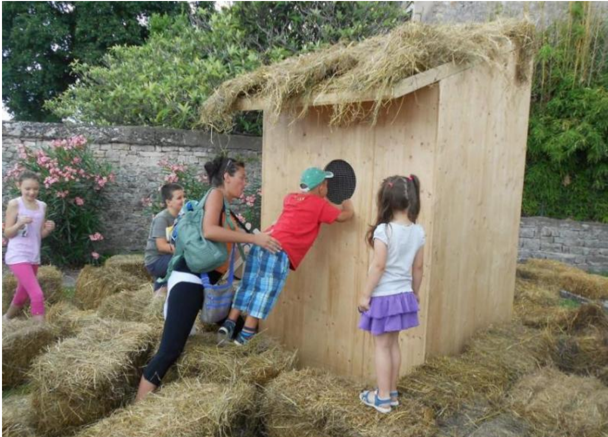
Slika 11. Najveća kućica za ptice