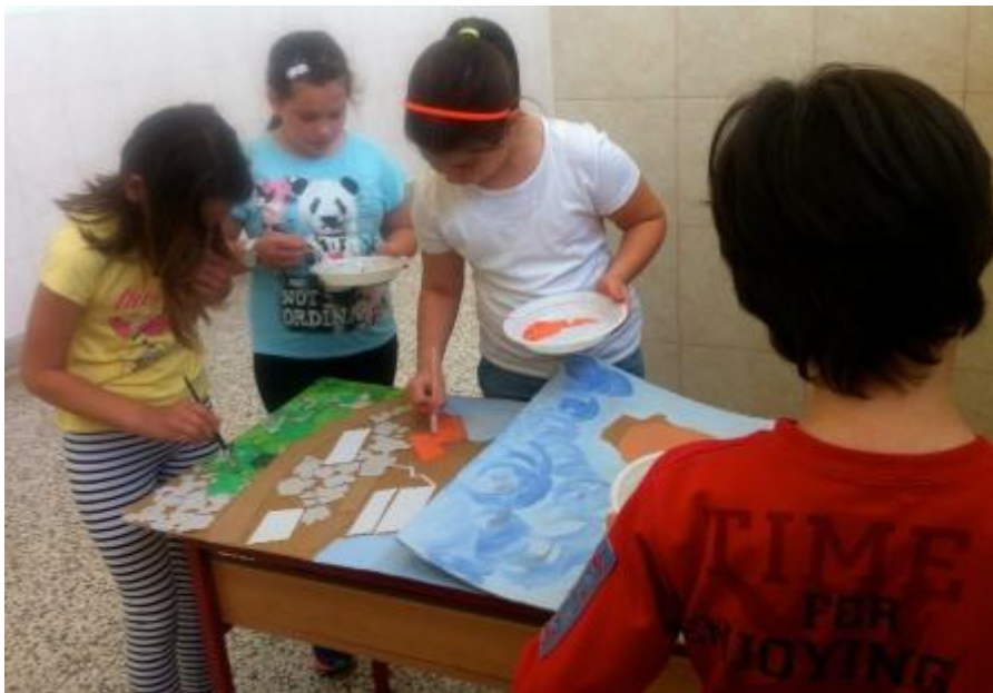
Slika 2. Proces nastanka slikovnice – 1.