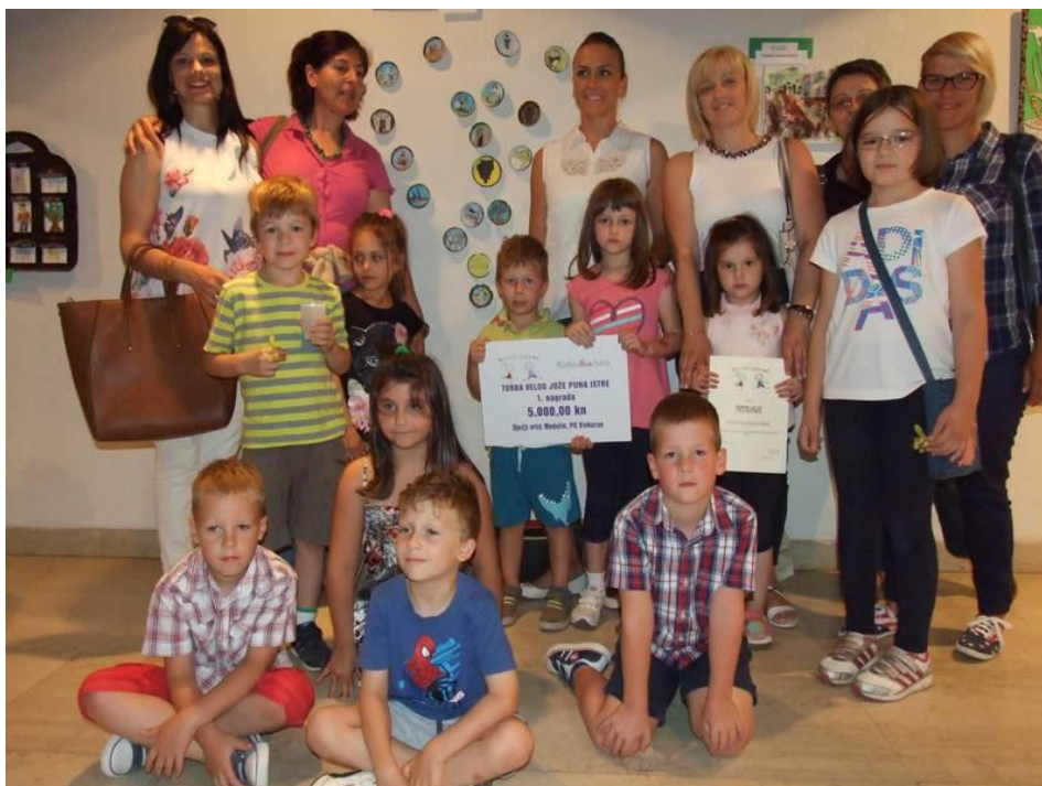
Slika 14. Dječji vrtić „Medulin“, područno odjeljenje Vinkuran