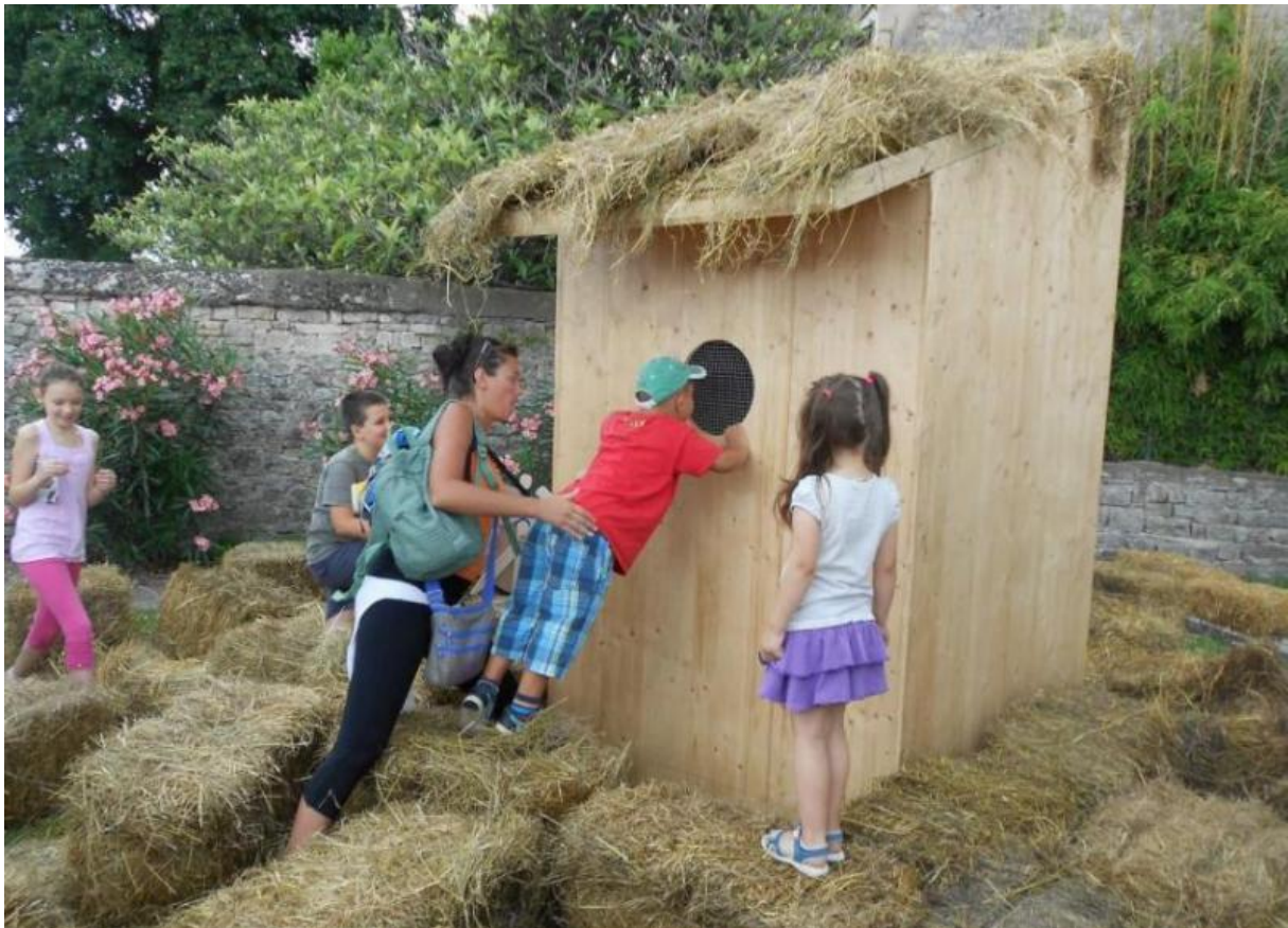
Slika 11. Najveća kućica za ptice