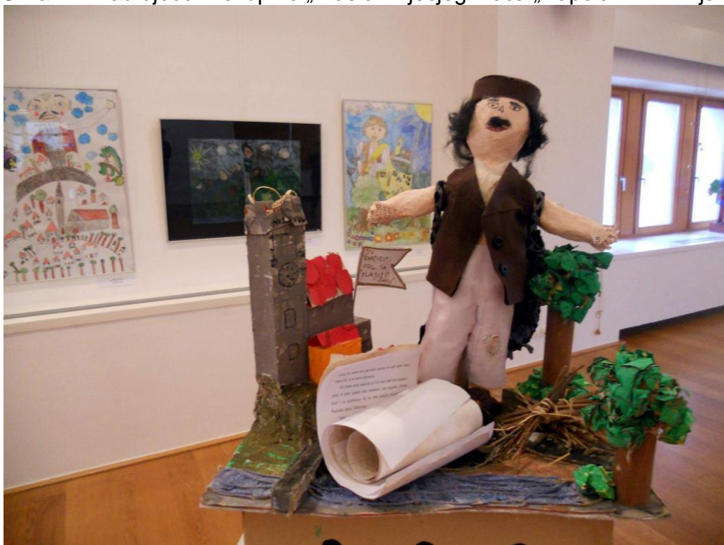
Slika 17. Rad djece iz skupine „Klasići“ Dječjeg vrtića „Rapčiči“ iz Žminja