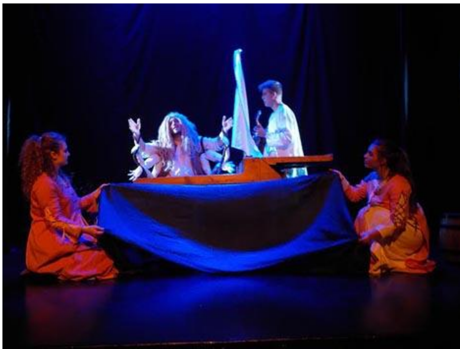
Slika 6. Veli Jože u izvedbi „Teatra Naranča“ – 1.