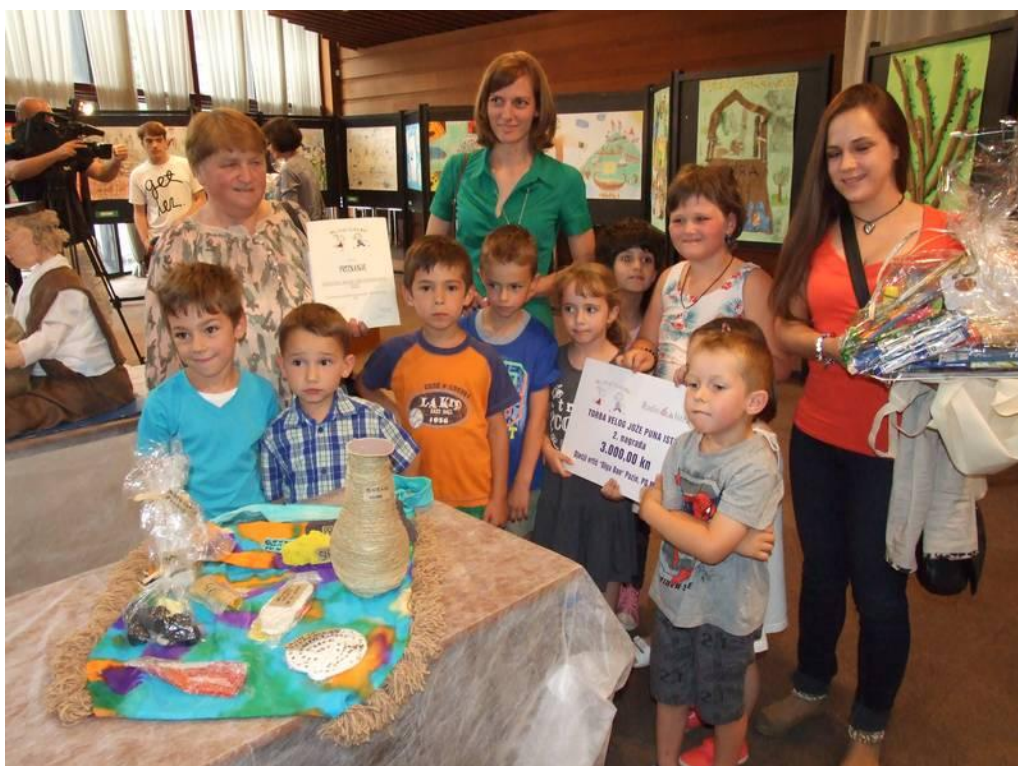
Slika 15. Dječji vrtić "Olga Ban" Pazin, područno odjeljenje Motovun