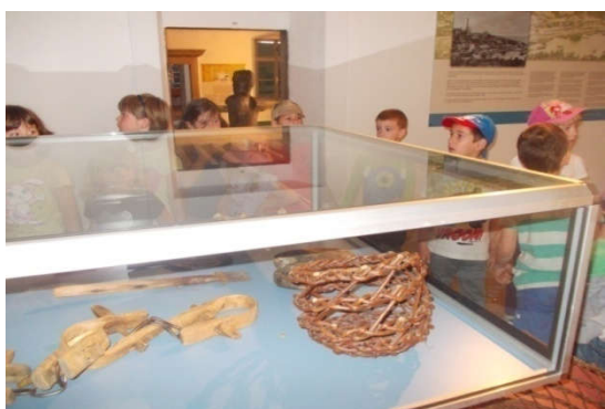
Slika 22. (pedagoška dokumentacija Dječjeg vrtića " Pjerina Verbanac", Labin.)