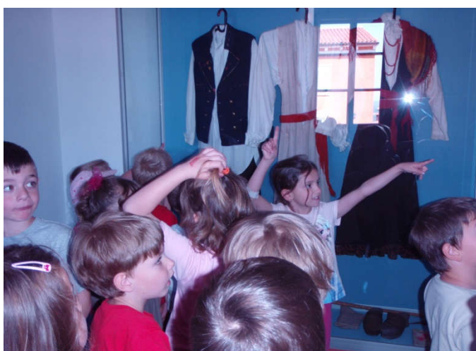
Slika 25. (pedagoška dokumentacija Dječjeg vrtića " Pjerina Verbanac", Labin.)

Kako bismo djecu potaknuli na istraživačke aktivnosti, trebalo bi s djecom posjećivati muzejske prostore kako bi u njima potaknuli kreativnosti i maštu te kako bi kroz razna istraživanja i eksperimentiranja učila na zanimljiv i interesantan način o novim spoznajama i činjenicama. Kakvoća i bogatstvo djetetova okruženja pozitivno djeluje na njegov razvoj. Struktura i organizacija okruženja utječu na djetetovo ponašanje i akcije te na komunikaciju i interakciju s vršnjacima i odraslima. Obogaćivanje ranog djetetova okruženja znači, između ostalog, i djelatniju uporabu muzejskih prostora u edukacijske svrhe. (Rosić, op. cit. str., 265-278).