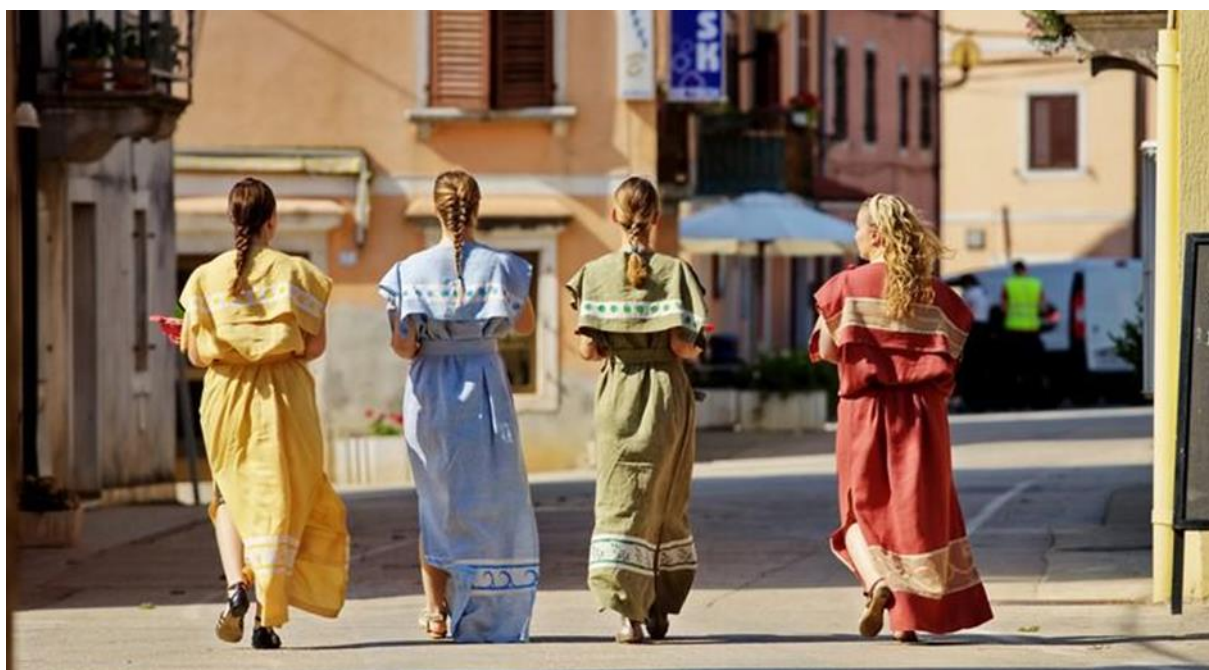
Slika 9. U bojama tradicije