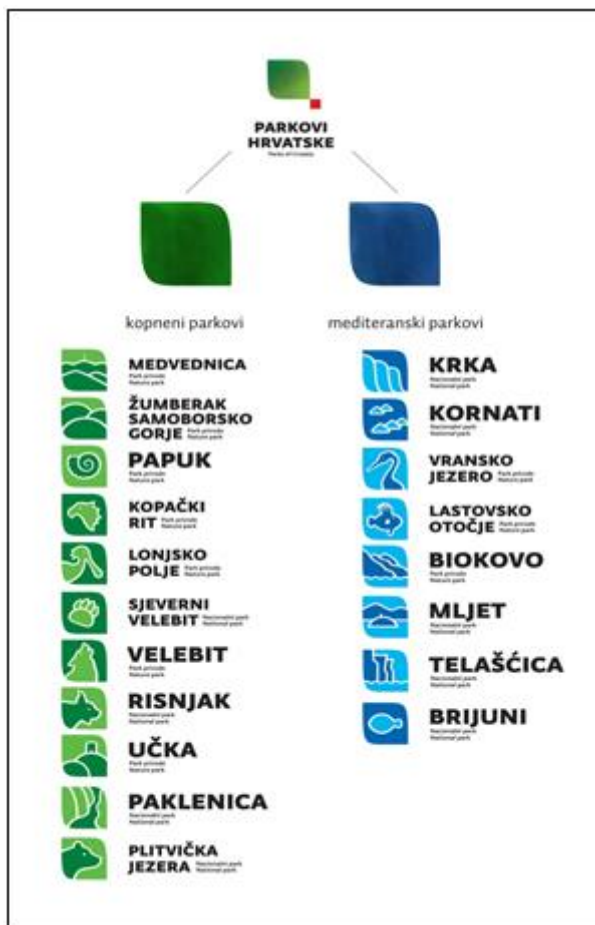
Slika 4. Parkovi Hrvatske