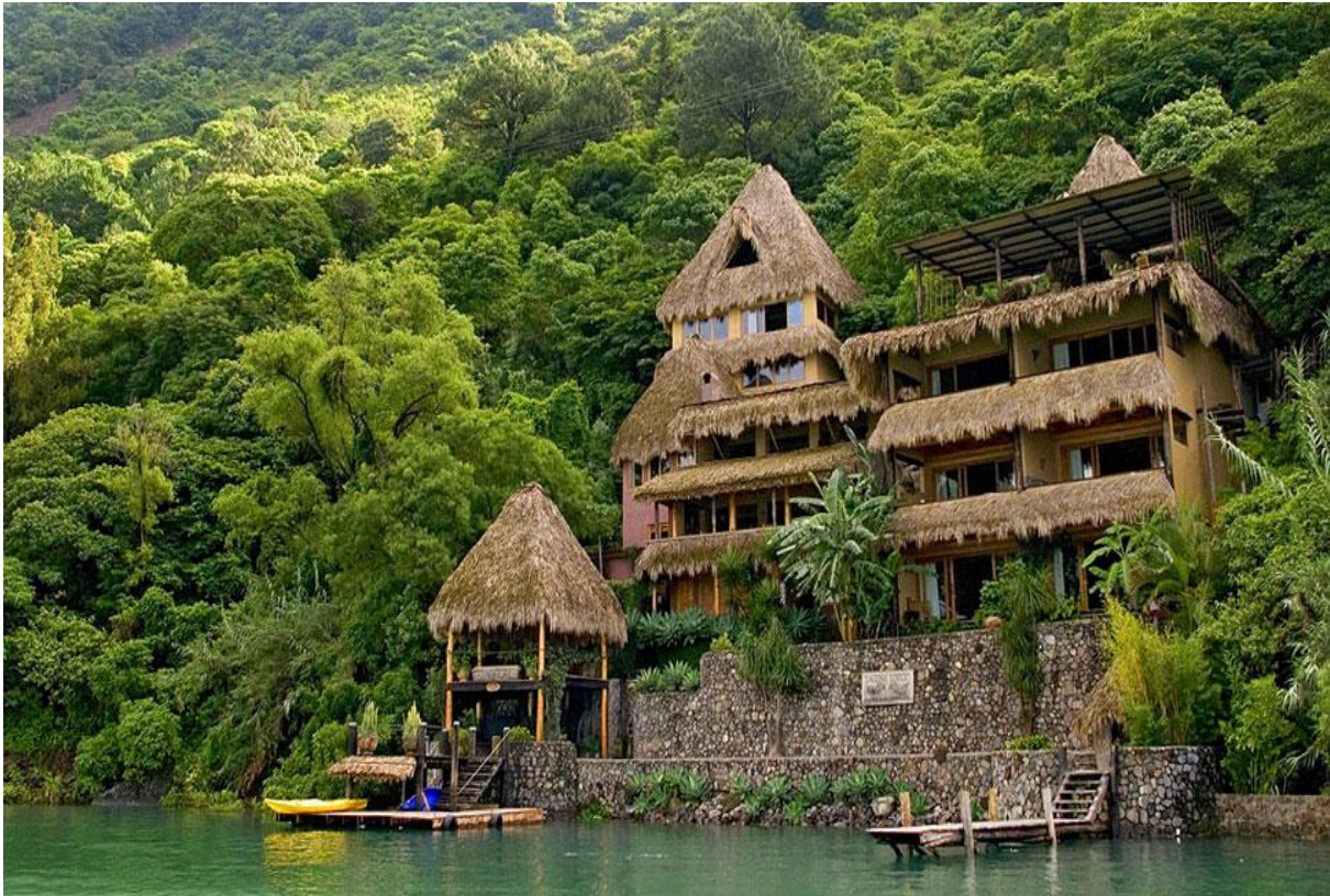
Slika 2. Eko resort – Gvatemala