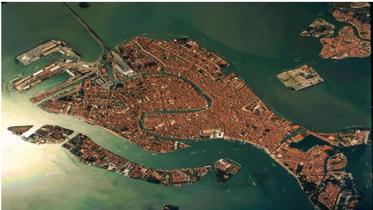
Slika 7. Venecija – Plutajući grad