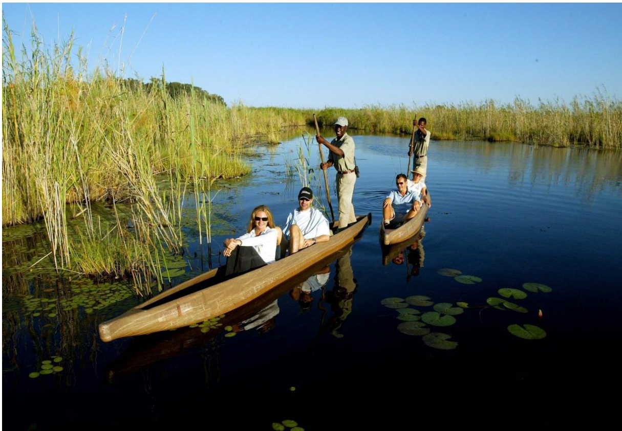
Slika 6. Mekoro safari