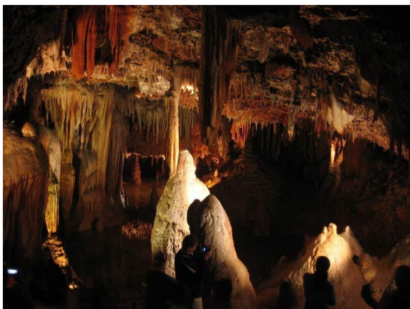
Slika 3. Unutrašnjost jame Baredine