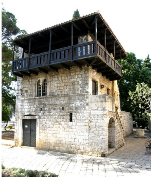
Slika 6. Romanička kuća