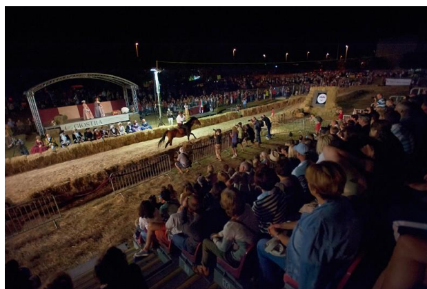
Slika 7. Viteški turnir Giostra