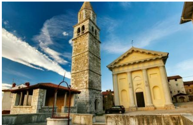
Slika 2. Župna crkva sv. Kvirika i Julite