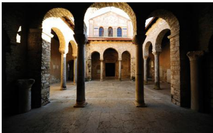
Slika 5. Kompleks Eufrazijane