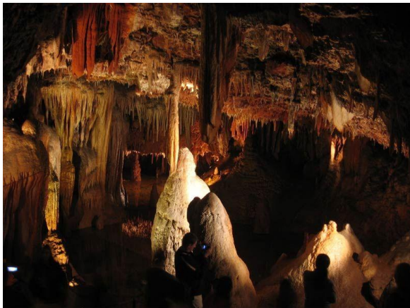
Slika 3. Unutrašnjost jame Baredine

(Izvor: www.istra.net , 12. ožujka 2017.)