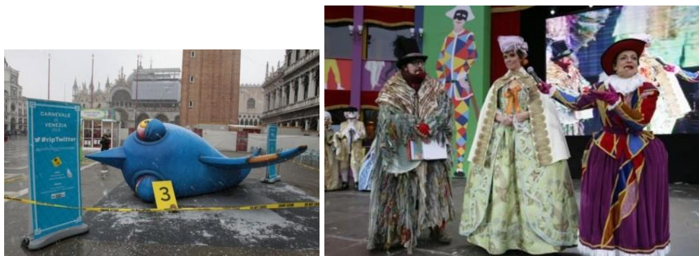
Slika 9.: Karneval u Veneciji

Od 1979. godine svake su godine kostimi bogatiji, a proslave spontanije. Dobro raspoloženje Venecijanki šokantno je za mnoge strance. Venecijanski dar za intrige dolazi na svoje za vrijeme karnevala, slikoviti festival prethodi korizmenom odricanju. Maske i kostimi imaju ključnu ulogu u tom svijetu anonimnosti; društvene podjele su razriješene, sudionici uživaju u psinama, a sve je dopušteno. Priređuju se raskošni balovi, a onaj glavni, veliki bal koji se svake godine događa u drugoj palači naziva se Duždev bal. Njemu mogu pristupiti samo ljudi s prikladnim baroknim kostimom kakav se ne može kupiti za manje od tisuću eura. Zainteresirani za taj bal moraju znati korake qadrille i drugih stoljećima starih plesova te biti spremni izdvojiti 200 eura za ulaznicu. Venecijanci drže da su ti maskirani balovi samo teške hedonističke perverzije. Pravi Venecijanci rijetko idu na takve balove. 58