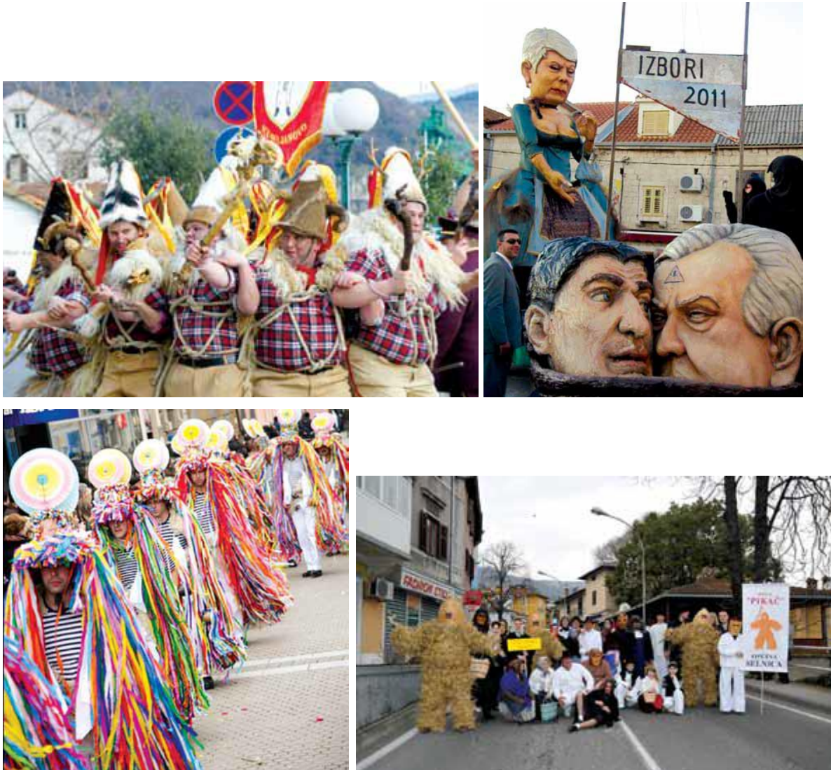
Slika 6.: Nekoliko karnevalskih likova iz različitih hrvatskih gradova