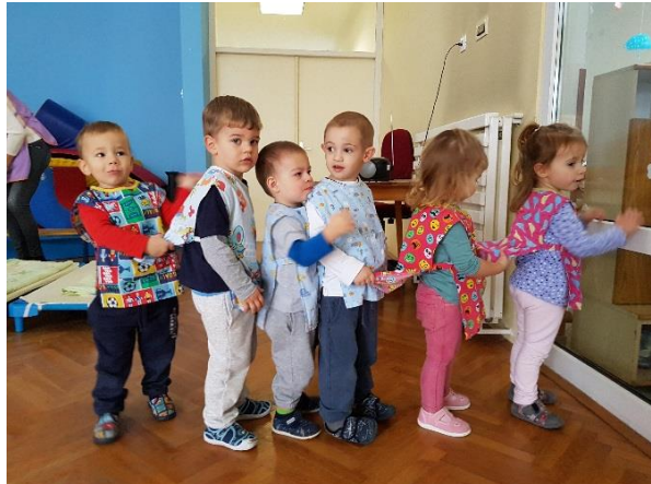
Slika 21. "Vlakić" je spreman za polazak

Zapažanja i izazovi: Vježbanje u dvorani najbolje je organizirati za vrijeme preklapanja radnog vremena odgajatelja. Često se događa da neko dijete treba odvesti do toaleta ili ga treba presvući, neko dijete treba spustiti sa švedskih ljestvi kako ne bi palo, treba riješiti poneki sukob, a ako glavna aktivnost zahtjeva asistenciju odgajatelj će se naći u problemu što prije riješiti. Isto tako, postavljanje dvorane za vježbu u većini slučajeva nije moguće prije sata. Kada je odgajatelj sam s djecom, ukoliko sprave i rekvizite uzima iz spremišta djeca ostaju sama (što nije dopušteno), a postavljanje može oduzeti dragocjeno vrijeme i raspršiti i onako nestabilnu pažnju djece.