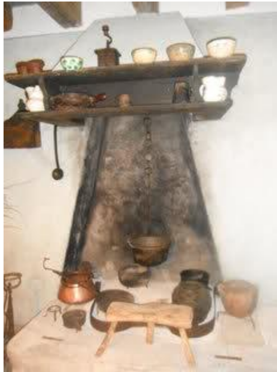
Slika 5. Ognjište