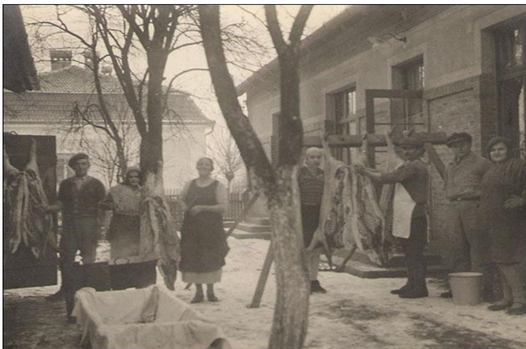
Slika 15. Prašćina