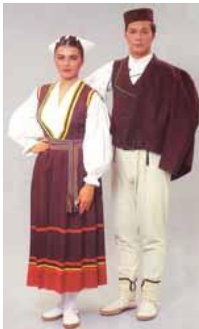
Slika 7. Istarska narodna nošnja