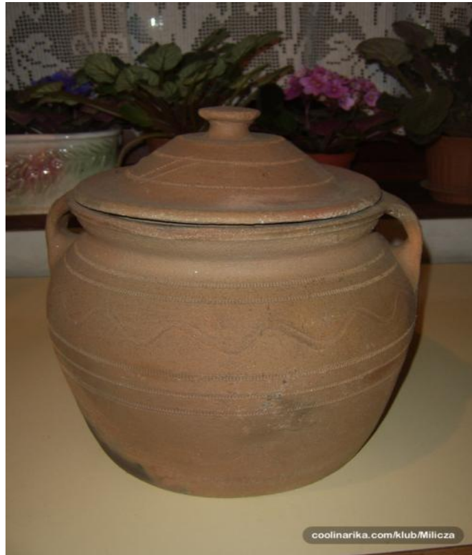
Slika 6. Zemljani lonac