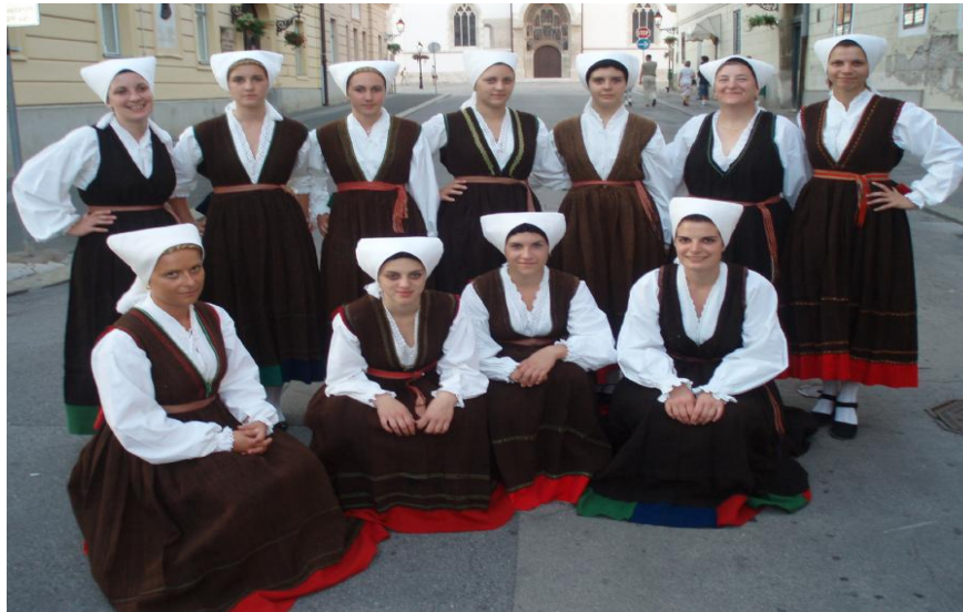
Slika 2 i 3. Primjeri istarskih narodnih nošnji

U Istri se tradicijski način odijevanja počeo postupno napuštati na kraju XIX.stoljeća. Dotada se odjeća pretežno izrađivala od domaće vune, većinom je bila u prirodnoj bijeloj ili smeđoj boji, izrađivala se i od konoplje, a u manjoj mjeri od lana. Vuna se po potrebi također stupala. Od kraja XIX.stoljeća sve se više upotrebljavala industrijska tkanina, koja je polako počela zamjenjivati onu predajnu. No u nekim krajevima kroj odjeće ostao je isti. Tradicijska se odjeća nosila uglavnom do kraja 1. svjetskog rata, a poslije su tradicijsku odjeću nosili ponajviše stariji ljudi, i to sporadično. Odjeća hrvatskoga jasno se razlikovala od one talijanskog stanovništva, a isto se tako razlikovala hrvatska nošnja od nošnji drugih manjina, naprimjer crnogorske u Peroju (crnogorska manjina u Peroj doseljena je 1567.godine iz Crmničke nahije). 14