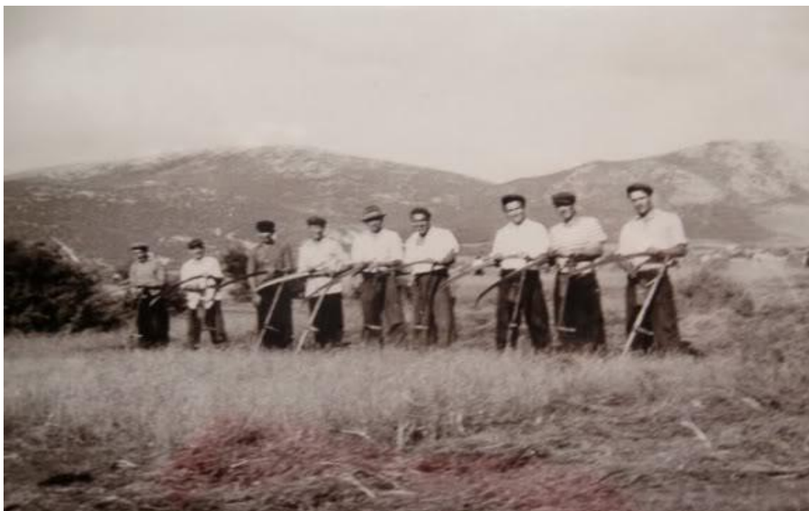
Slika 13. Kosidba trave