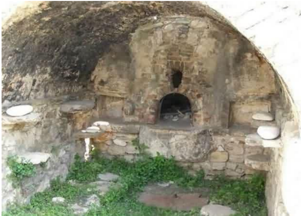
Slika 12. Stara krušna peć