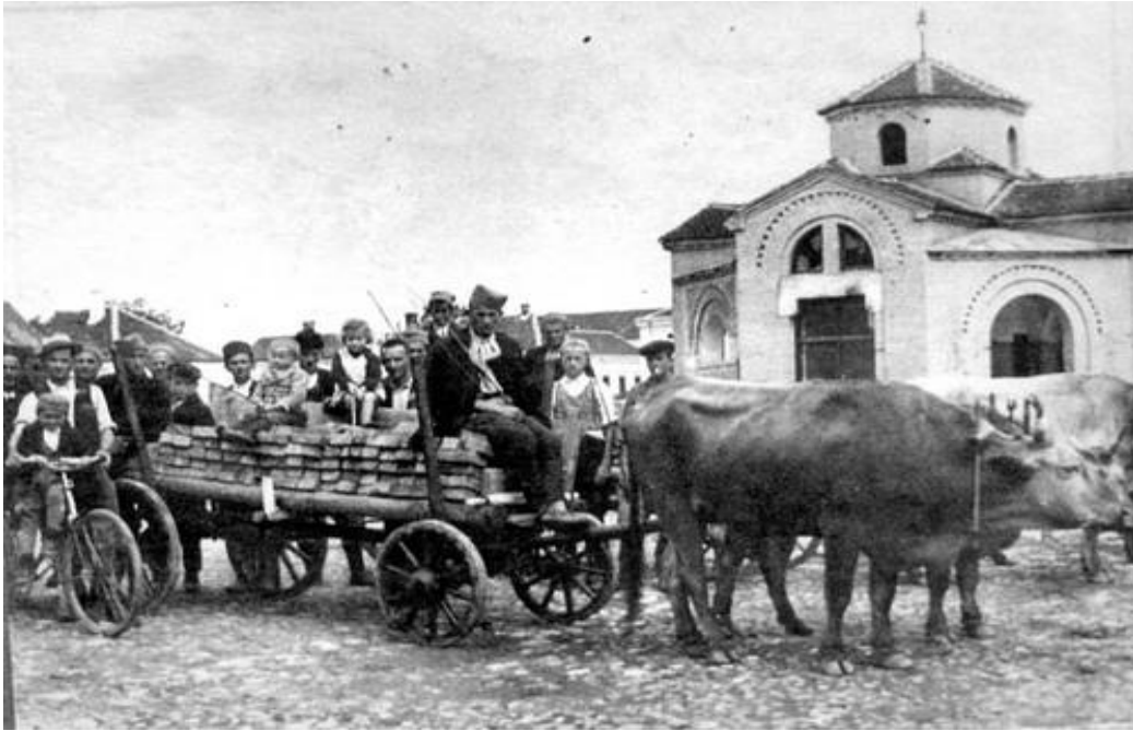
Slika 14. Volovska zaprežna kola