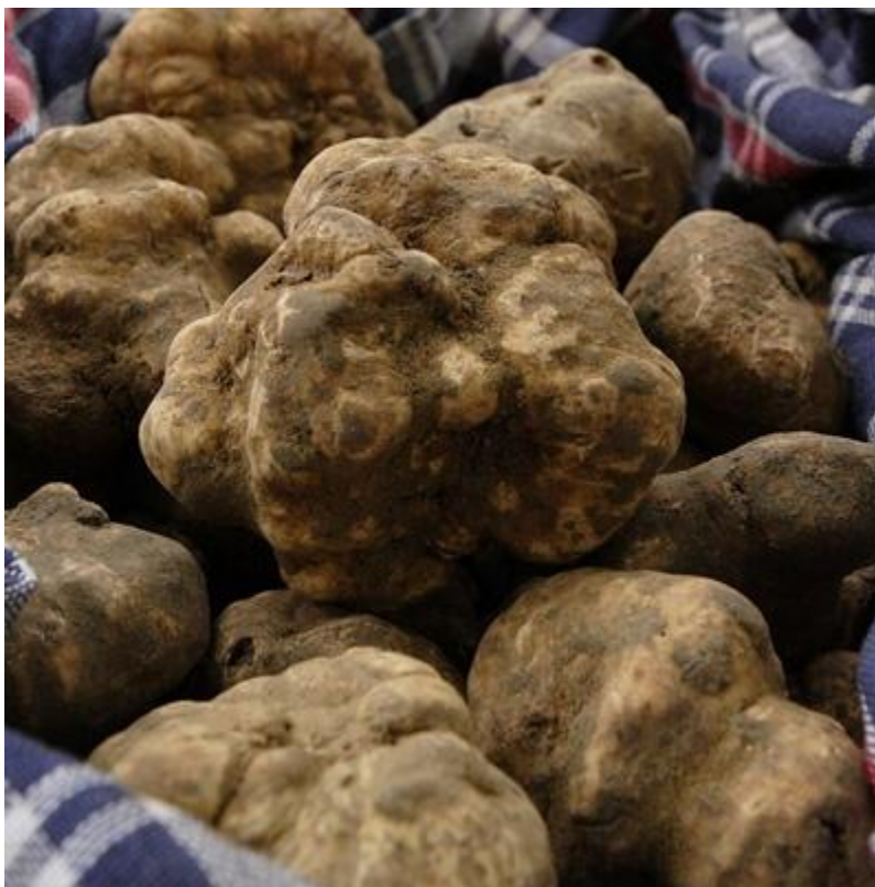
Slika 9. Bijeli tartufi