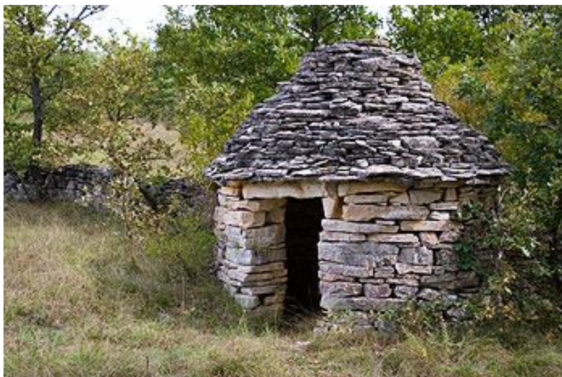
Slika 8. Kažun