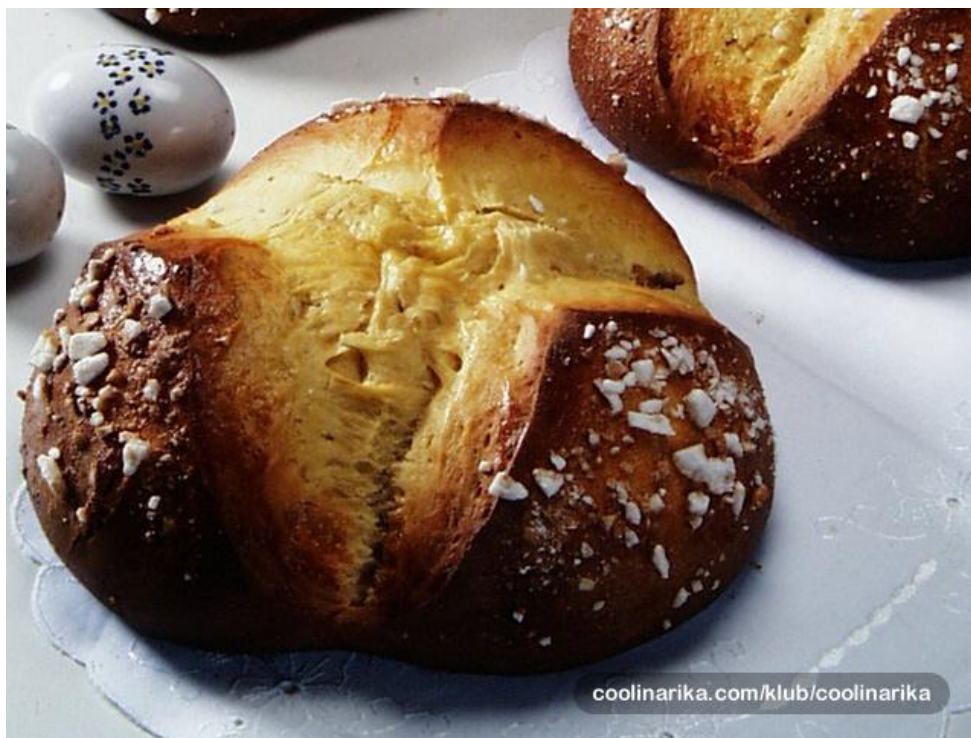
Slika 16. Uskršnja pinca