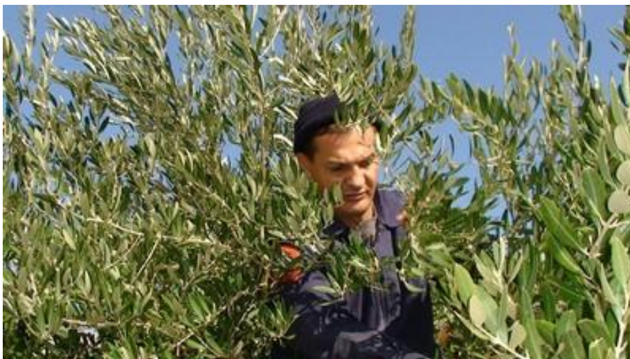
Slika 10. Branje maslina