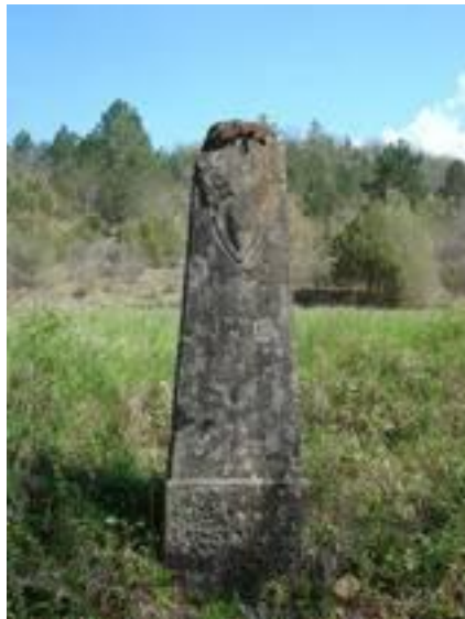
Slika 4. Kunfini ili granično kamenje