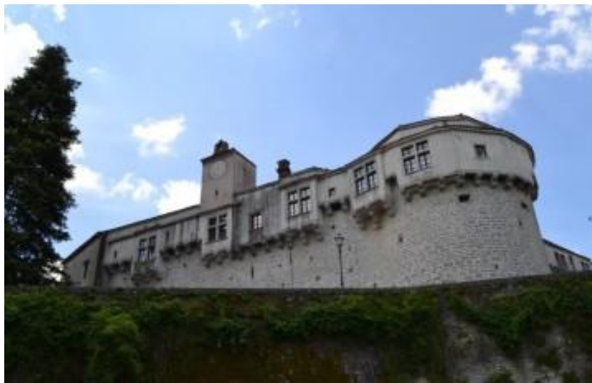
Slika 2: Pazinski kaštel