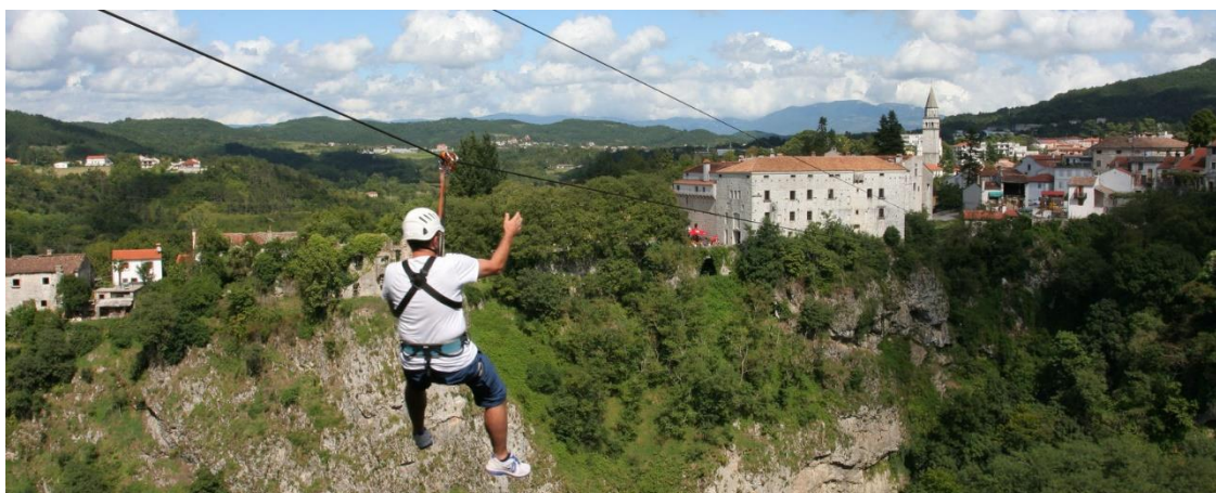
Slika 5: Zip line u Pazinu