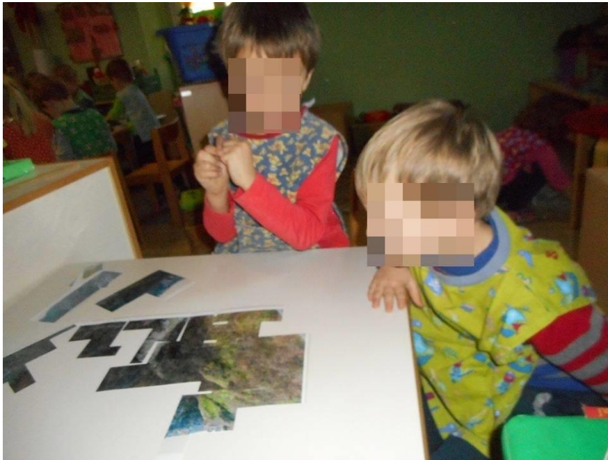
Slika 6: Izrezane slike „Pazinska jama“

Izvor: Autorica rada, (Datum: 14. veljače 2017.)