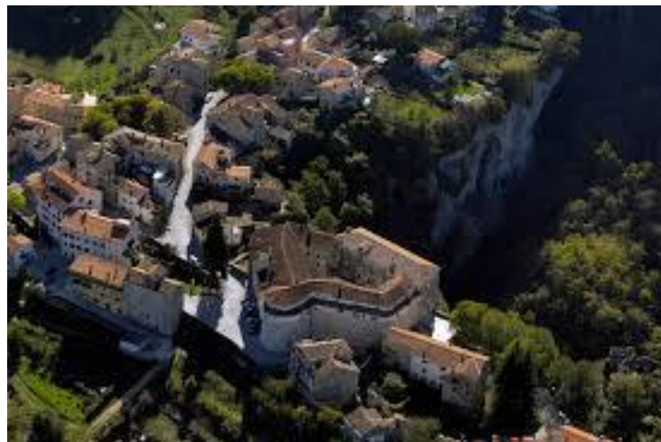
Slika 3: Pazinska jama u podnožju Kaštela