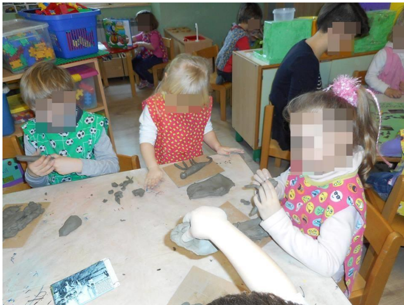
Slika7: Modeliranje volova (glina)

Izvor: Autorica rada, (Datum: 14. veljače 2017.)