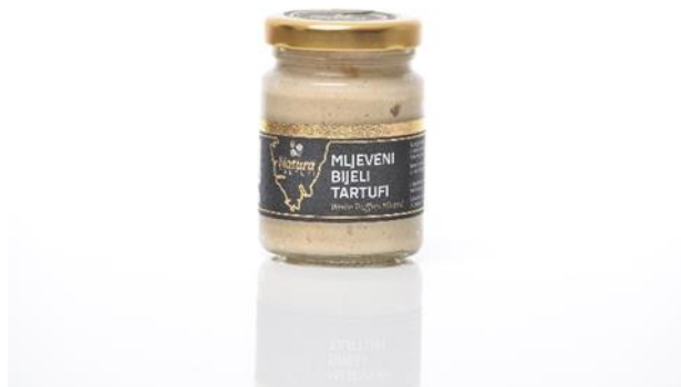
Slika 6.: Mljeveni bijeli tartuf.