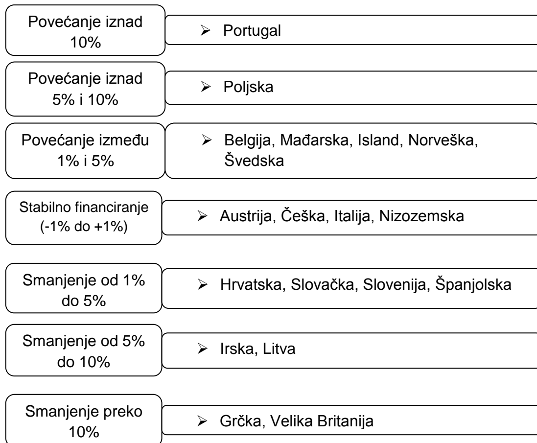
Slika 2. Trendovi javnog financiranja u 2013. – 2014.

Izvor: Financiranje visokog obrazovanja temeljem pokazatelja uspješnosti. Dostupno na: http://web.efzg.hr/dok/HRZZprojekti/Vasicek//Okrugli%20sto%20Financiranje%20visokog%20obrazovanja%20temeljem%20pokazatelja%20uspje%20nosti%20VV%20IDL%209122014.pdf (14.3.2017.)