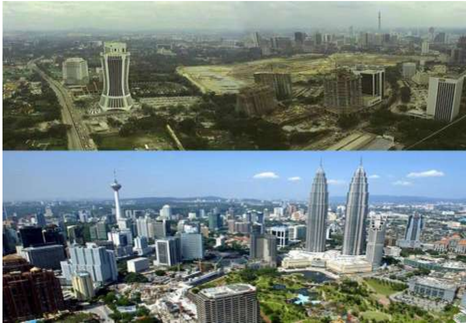
Slika 3. Kuala Lumpur, Malezija, 1990-2014.

Izvor: http://justsomething.co/before-and-after-world/ (6. svibnja 2015.)