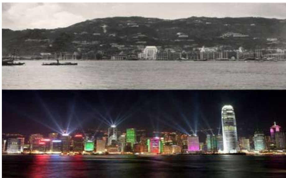
Slika 4. Hong Kong, Kina, 1920-2000.

Izvor: http://justsomething.co/before-and-after-world/ (6. svibnja 2015.)