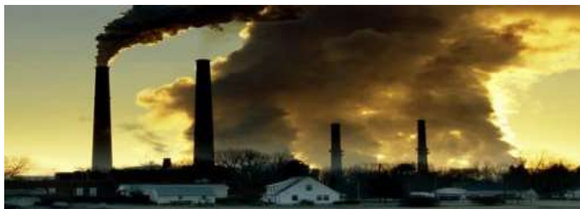
Slika 5. Utjecaj industrije na onečišćenje zraka

Izvor: Ekotrade (2014.): Opasnost u zraku, http://ekotrade.hr/clanci/opasnost-u-zraku/ (14. svibnja 2015.)