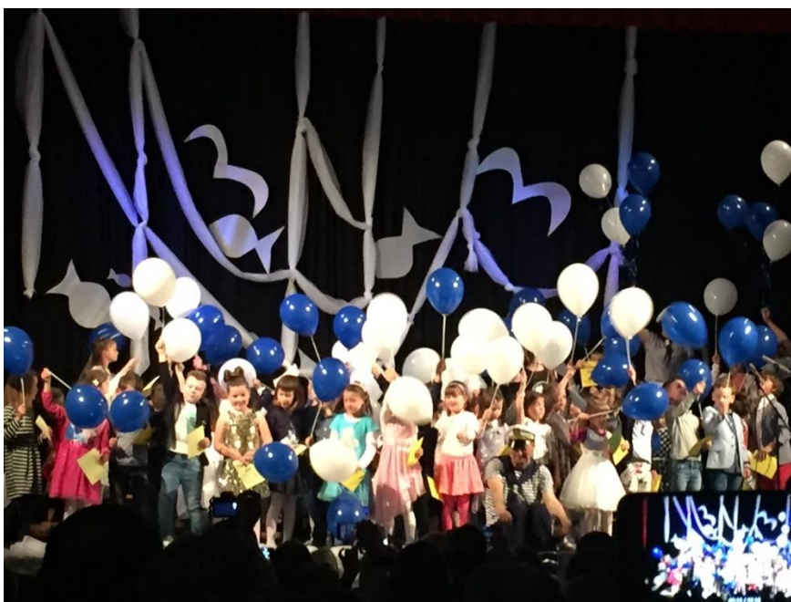
Slika 2. Zajednički nastup sudionika festivala Mali mali mikrofon