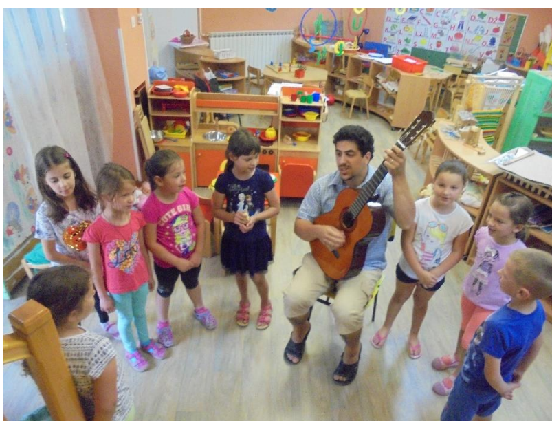
Slika 11. Uvježbavanje pjesme „Moja mat“