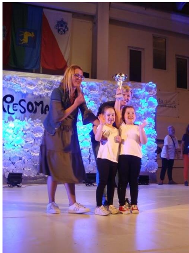
Slika 5. Dodjela pehara na natjecanju Plesomanija