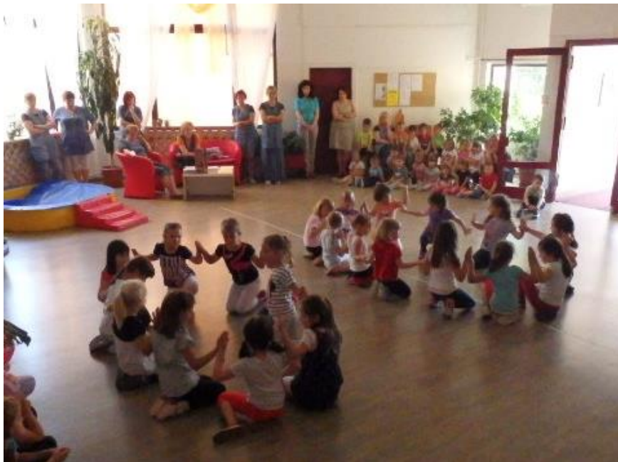
Slika 8. Nastup sudionika Plesno-folklorne radionice