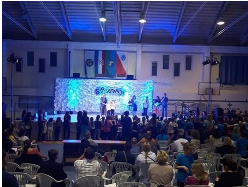
Slika 4. Natjecanje Plesomanija