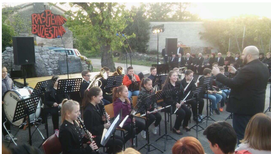
Slika 7. Nastup dječjeg orkestra na smotri Raspjevana Buzeština