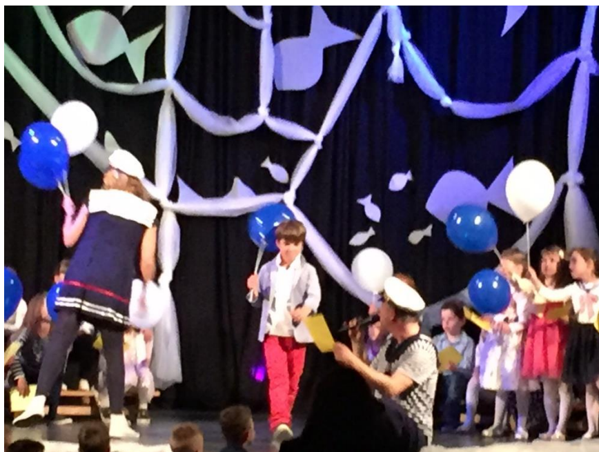
Slika 1. Nastup na festivalu Mali mali mikrofon