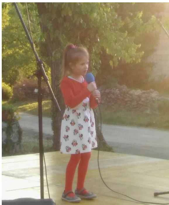
Slika 6. Nastup na smotri Raspjevana Buzeština