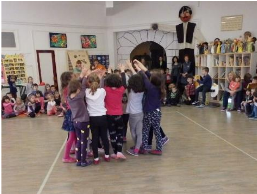
Slika 9. Nastup sudionika Plesno-folklorne radionice