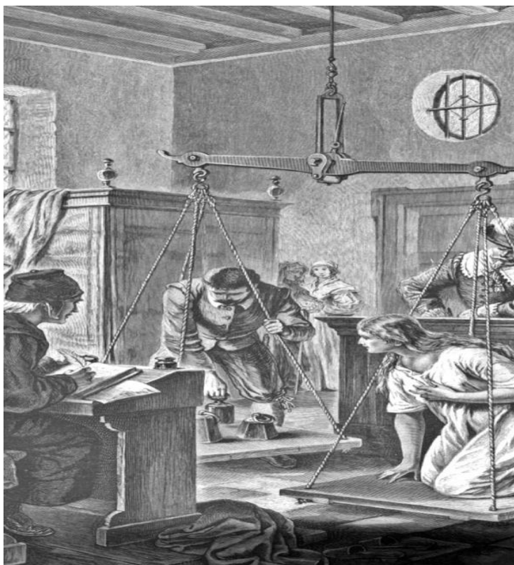
Slika 1. Prikaz vaganja 106 (dostupno na:

U Hrvatskoj se, kao i u ostatku Europe, na samom početku ispitivanja željelo pomoću različitih apsurdnih pokusa utvrditi je li optuženi vještac ili vještica ili nije. U ranom srednjem vijeku optužena osoba mogla se već na samom početku procesa osloboditi svake krivnje ukoliko bi izvršila jednostavne pokuse koji su bili stavljeni pred nju, a odnosili su se na „božansku intervenciju ili znak.“ 105 Kasnije su pokusi postali brutalni i puno zahtjevniji i to u tolikoj mjeri da ih je bilo gotovo nemoguće proći, što je rezultiralo još većom potvrdom krivnje optuženog. Najčešće su se provodili pokusi s vagom, optuženu se vagalo i ako se uspostavilo da nije teška vještica je, jer vještica mora biti lagana kako bi mogla letjeti.