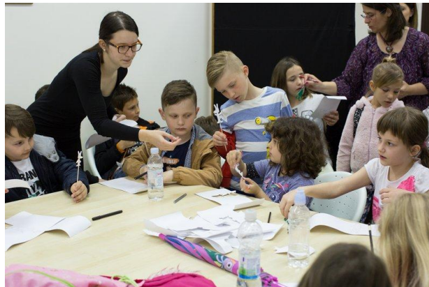
Slika 8. Izrada lutka

su naučili. Sljedećih su dana dolazila djeca predškolske dobi koja su nas pozitivno iznenadila svojim mudrim odgovorima na postavljena pitanja. Djeca su bila pokazivala veliku zainteresiranost i motivaciju za rad. Tijekom sudjelovanja u radionicama prikupila sam nove informacije koje će mi koristiti i biti od pomoću u daljnjem radu s djecom predškolske dobi. Stekla sam mnoga nova znanja, ali isto tako i dodatno iskustvo koje me je potaknulo na daljnja sudjelovanja u radionicama. Osim što ovakvim aktivnostima potičemo sebe na ulaganje truda i na marljiv rad, omogućujemo i djeci postizanje vidljivih rezultata i razvoj njihovih vještina.