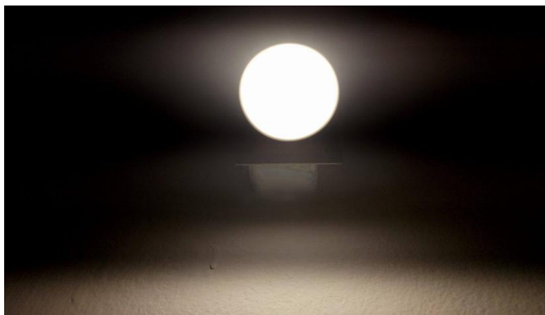
Slika 1. Svjetlost

Svjetlost možemo definirati kao zračenje, a svima je znana kao pojava pomoću koje možemo vidjeti. Ljudi ju često olako shvaćaju kao uobičajenu pojavu ne imajući na umu njezinu vrijednost. Djeca bi se već u najranijoj dobi trebala susresti s definicijom svjetlosti kroz razne aktivnosti i animacije koje su prilagođene njihovom uzrastu. Svjetlost dobivamo korištenjem sunčeve svjetlosti ili samostalnim stvaranjem svjetlosti koja je dobivena na umjetan način korištenjem raznih predmeta koji su dostupni ili predmeta koje možemo sami izraditi. Djeci valja objasniti da svjetlost možemo vidjeti pomoću naših očiju koje nam omogućuju razlikovanje boja koje se pojavljuju unutar svjetlosti. Njezinim isijavanjem vidimo boje među kojima su najčešće: ljubičasta, plava, zelena, žuta, narančasta i crvena. Svjetlost možemo stvoriti pomoću žarulja, vatre, baklje i raznih drugih predmeta. U dječjem vrtiću možemo primjerice koristiti žarulje koje ćemo postaviti unutar neke lampe koja će se uključiti u strujni krug i na taj način omogućiti osvjetljavanje prostora koji je prekriven tamom. Proučavajući svjetlost djeca mogu uočiti da će, ukoliko postave neki predmet ili pomoću tijela prekriju dio svjetlosti, nastati tama, odnosno sjena koja će njima biti nepoznat pojam.