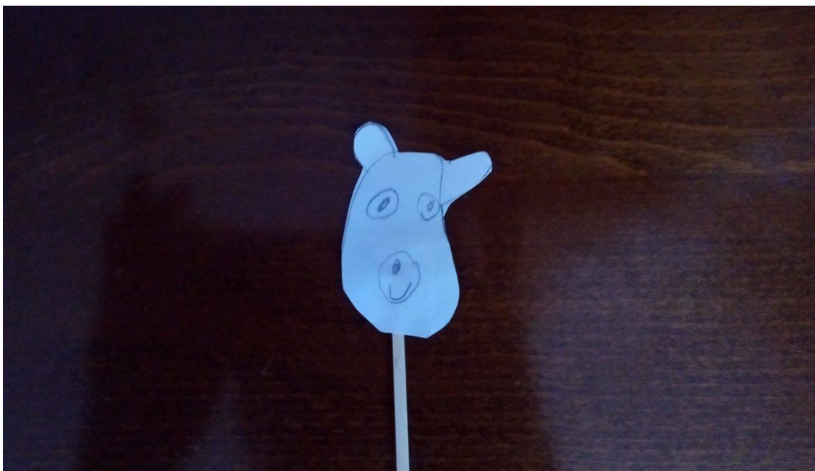
Slika 14. Lutka djevojčice A. I. (4 godine i 5 mjeseci)