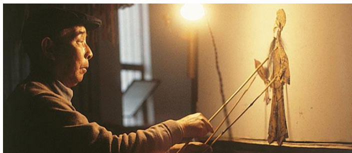
Slika 3. Prikaz izgleda scene

Važno je da gledateljima omogućimo i pružimo scenu koja će ih zainteresirati da prate sadržaj koji se izvodi. Na samome početku paravan mora biti okrenut prema publici dok će se svjetlost postaviti iza njega. Položaj lutke mora biti između svjetla i ekrana na paravanu, kako bi gledatelji u potpunosti mogli vidjeti oblik sjene. Lutkari, odnosno glumci koji animiraju lutke moraju se nalaziti iza ekrana i biti potpuno skriveni od gledatelja. U većini slučajeva taj se efekt može postići na način da se glumci odjenu u tamnu odjeću, odnosno odjeću crne boje. Radi postizanja boljeg efekta ili naglašavanja pojedine scene, koristi se glazba koja je prilagođena sadržaju predstave.