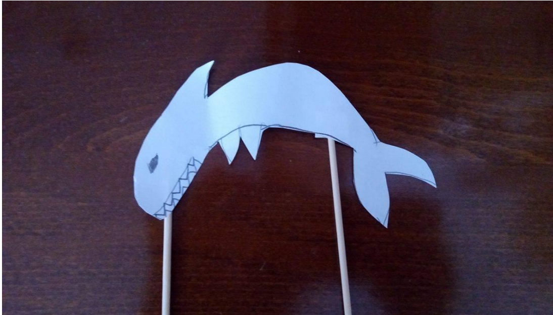
Slika 12. Lutka dječaka M. J. (5 godina i 8 mjeseci)