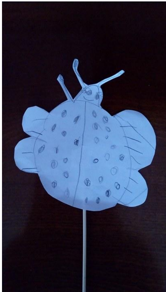
Slika 13. Lutka djevojčice P. A. (5 godina i 2 mjeseca)