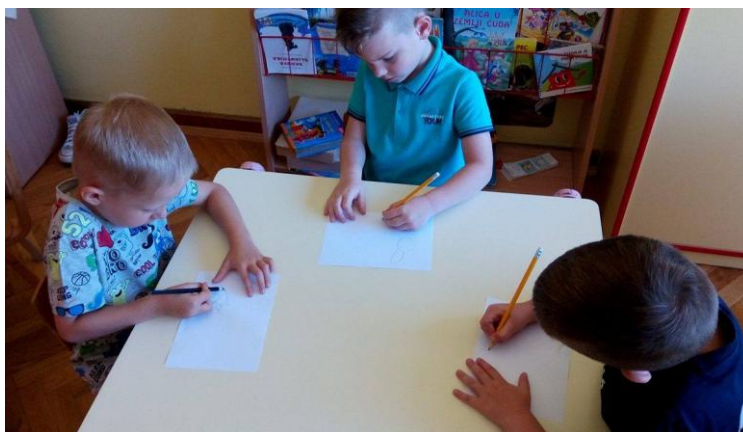
Slika 7. Izrada lutaka u DV

Izvor: fotografirala Petra Peršić, 3. 7. 2017.