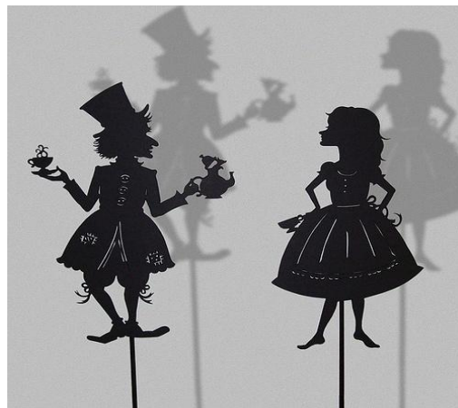
Slika 4. Prikaz lutaka sjena