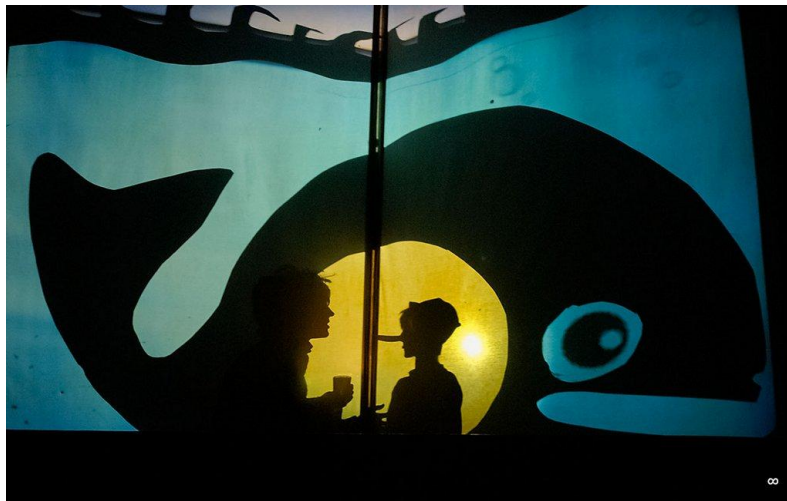
Slika 6. Pinocchio, Teatar Naranča

koje će dočarati pojedine scene i likove. Postoje mnoge aktivnosti kojima će se izvoditi sjene, a jedna od zanimljivijih djeci i odraslima je crtanje s pijeskom. Pritom se mogu koristiti i razne mrežice pomoću kojih će se postići bolji efekt. Lutke se mogu izrađivati pomoću platna, papira, plastike, drva i mnogih drugih materijala koji se mogu jednostavno nabaviti. Djeca predškolske dobi mogu samostalno izrađivati sredstva potrebna za izvođenje predstave u kazalištu sjena. Važno je omogućiti djeci raznovrsne aktivnosti u kojima će, uz pomoć odrasle osobe, stvoriti svoje kreativne radove. "Teatar Naranča" iz Pule potiče djecu i odrasle na sudjelovanje u predstavama. Sve su njihove predstave radovi akademskih glumaca, redatelja, slikara, glazbenika te polaznika dramskog studija koji se uključuju kako bi stekli nova iskustva i znanja. Jedan od glavnih ciljeva je poticanje djece na sudjelovanje u predstavama kako bi ona mogla samostalno izrađivati predmete od raznovrsnog materijala. Predstave „Pinocchio“ i „Snježna kraljica“ su karakteristične po tome što se u njima javljaju elementi kazališta sjena. Gledatelji su se prilikom izvođenja mogli u potpunosti uživjeti u sadržaj predstave zbog različitih pokreta ruku i modela lutaka koje su bili izrađene od raznovrsnog materijala. U predstavi „Snježna kraljica“ koristili su se različiti efekti kao što je primjerice dočarano padanje snijega i korištenje svjetla u raznim bojama.