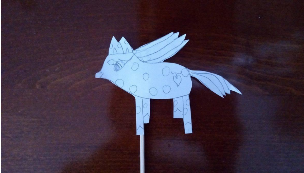
Slika 11. Lutka djevojčice A. J. (6 godina i 4 mjeseca)

Nakon što su djeca završila s izradom lutaka na štapu svako sam dijete zamolila da mi kaže ime svoje životinje i zašto je baš odabrao životinju koju je nacrtao. U nastavku donosim analizu pet odabranih radova.