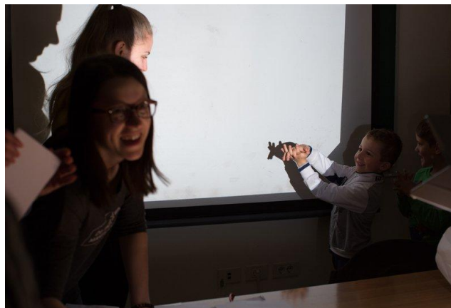
Slika 9. Dijete istražuje sjenu pomoću svojih ruku