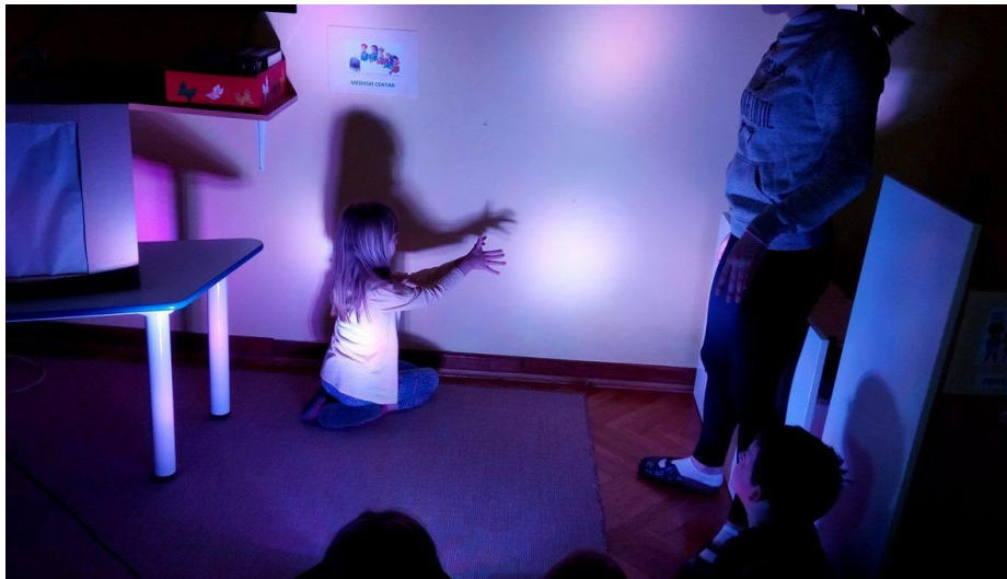
Slika 2. Dijete istražuje vlastitu sjenu

zaklonjeno tako da u nj izravno ne prodire svjetlost, prostor zaklonjen od sunca. (Anić, V., 2007: 513 str.) Odrasli se ljudi i djeca sa sjenom susreću često i u različitim situacijama. Primjerice, ponekad možemo u sobi na zidu vidjeti sjenu svoga tijela ili nekog predmeta koji nam se nalazi u blizini. Djeca se u najmlađoj dobi mogu preplašiti svoje sjene, no s vremenom ju počinju promatrati i istraživati. Kroz razne aktivnosti i igre sjenu možemo približiti djeci, ali je važno na samome početku djeci objasniti pojam sjene na način da im ukažemo na njezine bitne karakteristike. Nakon što djeca usvoje osnovne pojmove možemo im ukazati na mogućnost stvaranja vlastitih sjene pomoću tijela kreiranjem različitih likova kao što su primjerice životinje.