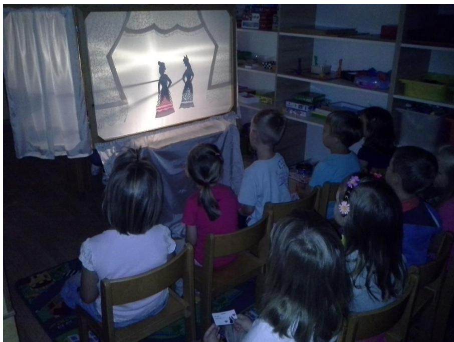
Slika 9: Pepeljuga