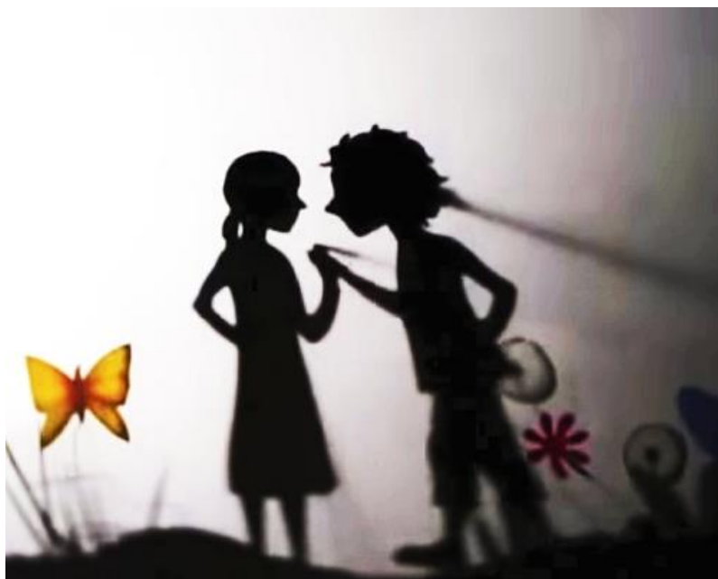
Slika 5: Prizor kazališta sjena

Osim što u kazalištu sjena možemo koristiti ruke, za glumu nam najčešće služe plošne lutke na štapićima. Lutke mogu imati pokretne dijelove, mogu biti napravljene od folija u boji, imati iscrtane detalje itd., sve navedeno pridonosi da lutke budu uočljivije i time ostaju duže u sjećanju gledatelja. Kazalište sjena nam omogućuje i igru sa svjetlom. Ako su lutke bliže platnu one će biti manje i vidjeti će se više detalja na njima, dok ako ih odmaknemo od platna biti će veće. Prilikom izrade važno je zapamtiti kako se radi poluprofil lutke jer se tako mogu najbolje istaknuti detalji lutke.