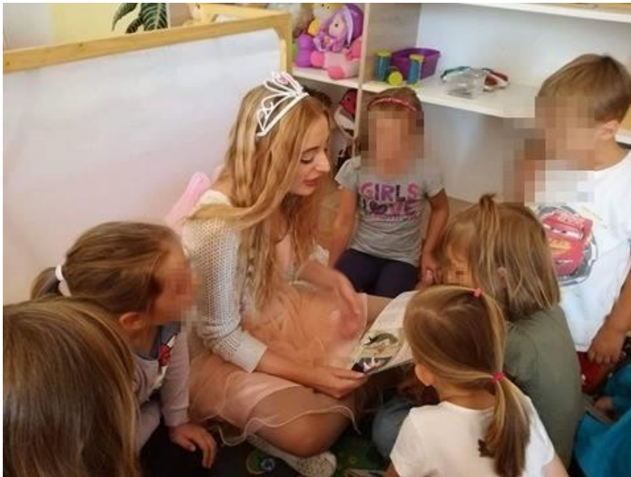
Slika 14: Čitanje Ježeve kućice