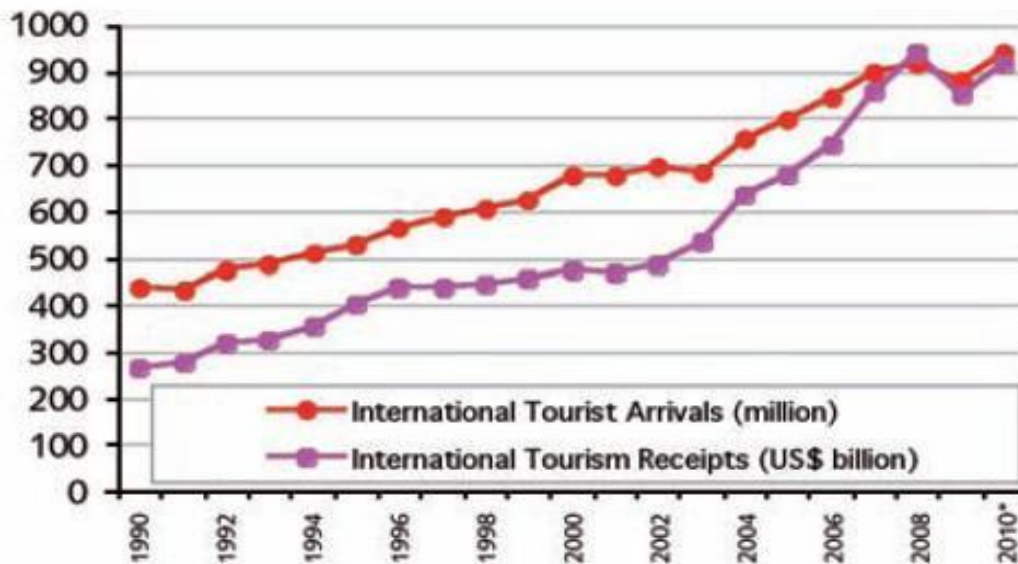
GRAF 1. Turistička kretanja 1990. do 2010.godine